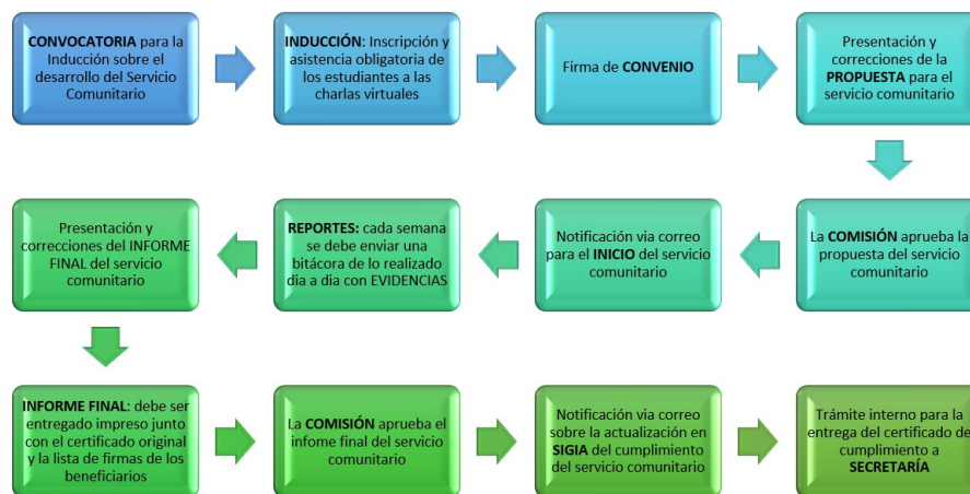
FIGURA1 Pasos a seguir para el cumplimiento del servicio comunitario.

Durante los siguientes pasos, se elabora y presenta el informe final del servicio comunitario, para su correspondiente revisión y aprobación por parte de la unidad de vinculación, el mismo que una vez aprobado, da paso a la actualización de los datos en la plataforma institucional de cada uno de los estudiantes, reflejando el cumplimiento de las horas del servicio comunitario.