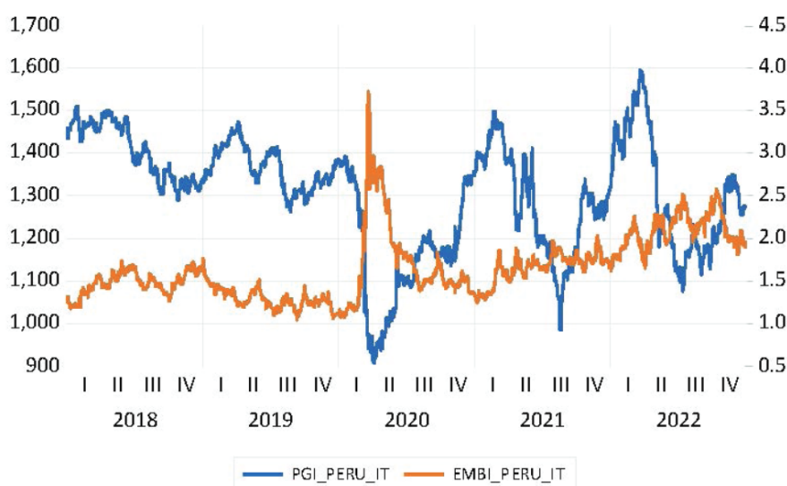
Figura 4. Gráfico de línea para el contexto peruano

Para el caso de Perú, se elaboró la gráfica donde se observa el comportamiento de las series S&P Bolsa de Valores de Lima - Perú General Index y Emerging Markets Bonds Index – Perú, proporcionando indicios que aperturan la deducción de causalidad entre las series, como se presenta en la Figura 4.