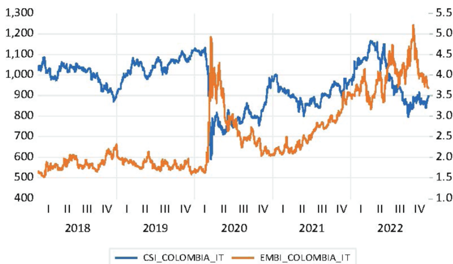
Figura 3 Gráfico de línea para el contexto mexicano