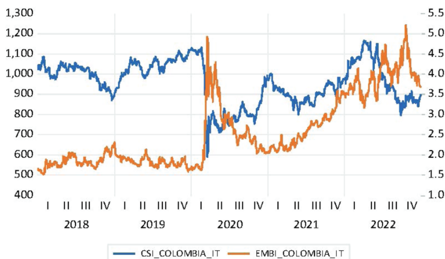
Figura 2 Gráfico de línea para el contexto colombiano

Para el caso de Colombia, se inició la generación de la gráfica donde se puede observar el comportamiento de las series S&P Colombia Select Index y Emerging Markets Bonds Index – Colombia, proporcionando indicios que aperturan la deducción de causalidad entre las series, como se presenta en la figura 2.