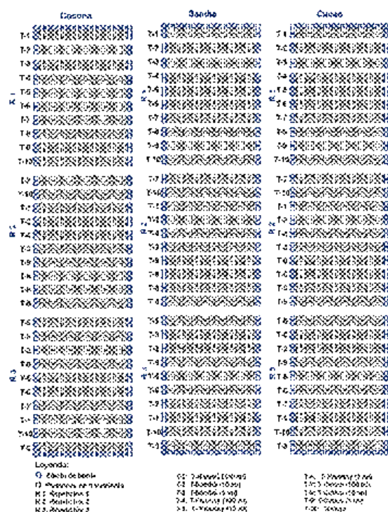
FIGURA 1 Distribución de los tratamientos en bloques de tres especies Theobroma cacao “cacao”, Citrullus lanatus “sandia” y Solanum sessiliflorum “cocona”.

El tipo y diseño de investigación fue experimental. Para las evaluaciones de germinación los tamaños de muestra que se trabajaron fueron con 9 tratamientos y un (1) testigo más tres (3) repeticiones por cada uno de ellos, por especie de semilla (sandía, cocona, cacao) tal como se observa en la figura 1.