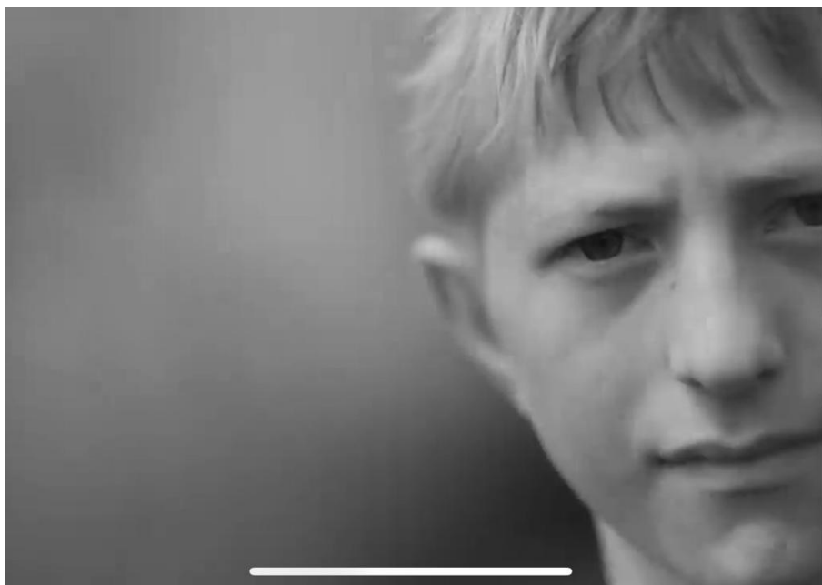
IMAGEM 5 Criança do videoclipe Zombie