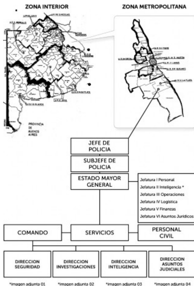
*imagen adjunta 01 *imagen adjunta 02 *imagen adjunta 03 *imagen adjunta 04