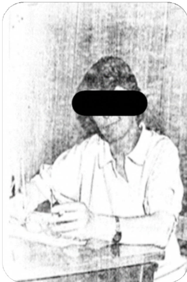
Imagen 2. CPM, Fondo Documental DIPPBA, Mesa Ds, Varios, Legajo N°25.625, Fojas 3 y 5.