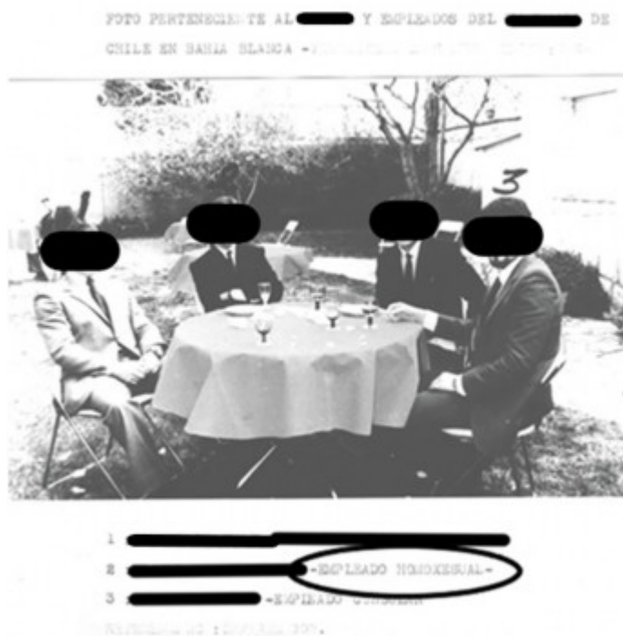
Imagen 3. CPM, Fondo Documental DIPPBA, Mesa Cicia., Legajo N° 22.