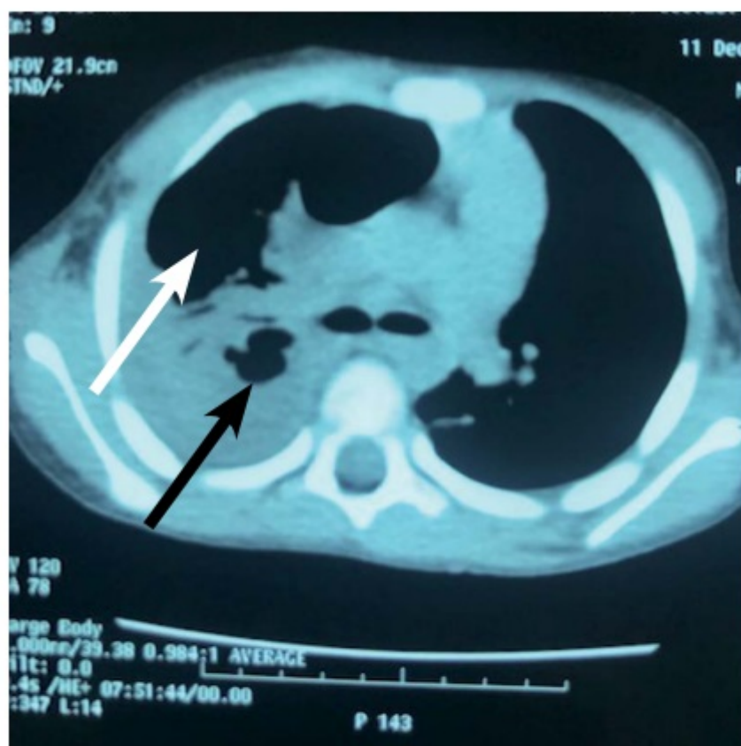
Figura 2. Tomografía de tórax a los 12 días de evolución. Se observa el neumatocele (flecha blanca) y abajo el empiema y paquipleuritis (flecha negra).