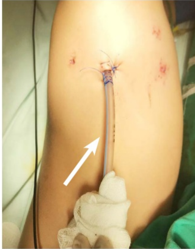
Figura 3. Postoperatorio inmediato. Sonda pleural french número 18 (flecha blanca) a través del sitio del trocar de 10 mm y se observan el sitio de los otros 2 trocates de 5 mm.