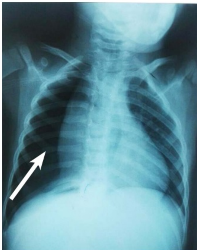
Figura 1. Radiografía de tórax proyección anteroposterior al ingreso. Se observa neumotórax derecho a tensión (flecha blanca) con desviación del mediastino hacia el lado contralateral.