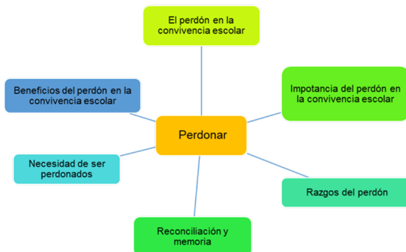
Figura 3 Aspectos relevantes sobre el perdón en la convivencia escolar.

En la Figura 3 se muestran 6 aspectos relevantes sobre el perdón en la convivencia escolar; como se pueden citar: el perdón en la convivencia escolar, importancia del perdón, rasgos del perdón, reconciliación y memoria, necesidad de ser perdonados y beneficios del perdón. Cada uno de los aspectos relevantes se amplían con más detalle en la discusión.