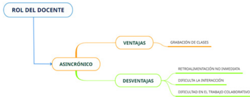
Figura 3 Asincrónico