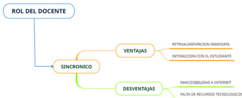
Figura 2 Sincrónico.

Adicional, los entrevistados señalaron que la comunicación sincrónica tiene la desventaja que para acceder a ella se requiere mayor implementación de recursos tecnológicos tales como cámara web, micrófono y accesibilidad al servicio de internet o teléfono que, para el caso de muchos estudiantes no disponen por las dificultades económicas que vienen atravesando sus familias véase Figura 2.