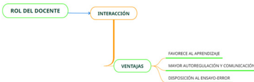
Figura 4 Interacción

Los docentes entrevistados al respecto mencionaron que, la interacción, entre los entes educativos principales, fortalece la construcción de los aprendizajes significativos, por cuanto, exige del estudiante mayor auto regulación y comunicación. En el trabajo, señalaron los entrevistados, los estudiantes que tenían poca o nula participación cuando se desarrollaba de manera presencial, ahora recurren a los mensajes de texto o las grabaciones para participar y opinar, por tanto, están más dispuestos al ensayo-error, permitiéndoles superar la timidez de enfrentar a un grupo de manera directa. De esta manera, hay más participación; incluso se traslada al aspecto emocional pues muchos estudiantes comparten sus emociones y sentimientos aprovechando la línea telefónica o mensajería de texto, por ende, se evidenció que el clima adecuado y de confianza siempre es necesario. Véase Figura 4.