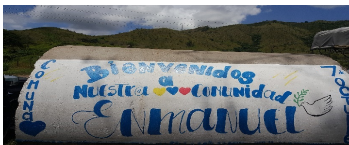
FIG NO 3. Identificación de la Comunidad Enmanuel, en el municipio Ezequiel Zamora. Elaboración propia.

Uno de los 18 municipios que forman parte del estado de Aragua, en Venezuela es la comunidad Enmanuel (FigNo 3) que se encuentra en el municipio Ezequiel Zamora, su capital es Villa de Cura. En esta comunidad se desarrolla la cartografía social con el objetivo de identificar los principales problemas sociales y buscar vías de solución.