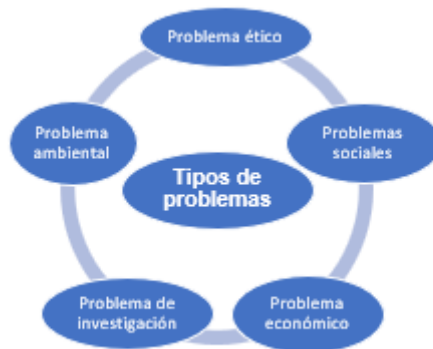
FIG NO. 1 Tipos de problemas. Elaboración propia

Para enfrentar un problema se deben buscar técnicas que se emplean para identificar una situación problemática (un problema central) y el árbol de problemas es una técnica utilizada para estos fines, es una herramienta que permite obtener información con una visión simplificada, concreta y ordenada de cada causa (cada raíz del árbol), su impacto (cada rama del árbol) y ponderación en el problema (visualizar qué raíz o rama es la más importante, la que tiene más ramificaciones y cuyos efectos sean determinantes). Es una técnica que puede realizarse en forma individual o grupal. (Betancourt, 2016).