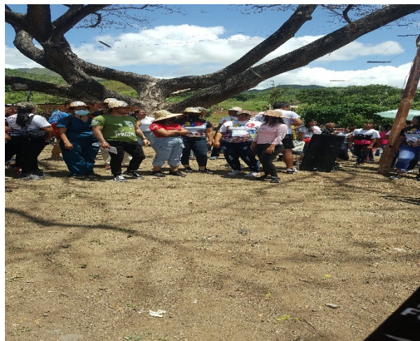
FIG NO. 4.

La integración de los habitantes juega un papel fundamental para el análisis, reflexión y comprensión de los entornos de la comunidad, así como para compartir sus ideas en esta investigación (Fig. No, 4).