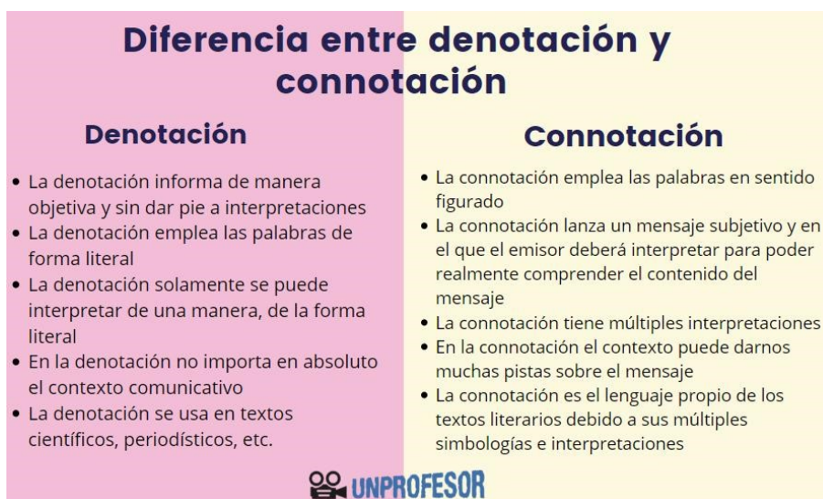
FIGURA 1 Comparación entre denotación y connotación

De esta manera, denotación y connotación son conceptos que se manejan como opuestos y a la vez complementarios. Su unidad dialéctica relativa se visualiza desde la figura 1m que compara ambos términos y sus modos de empleo.