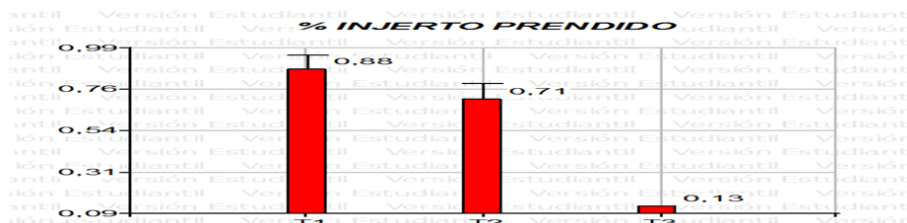
FIGURA 3 Porcentaje de prendimiento

En la Figura # 3 se observa el porcentaje de prendimiento de cacao, el tratamiento (T1) es el mejor con un 0,88%, siguiéndole el tratamiento (T2) con un 0,71% y el T3 fue el que obtuvo menos prendimiento.