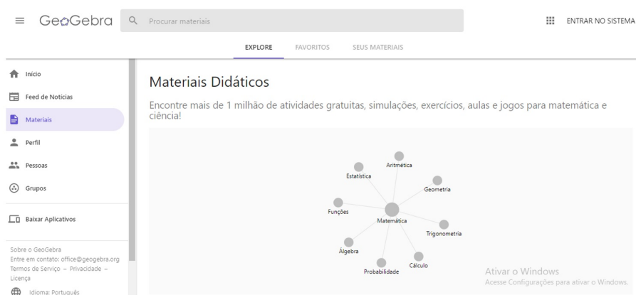
Figura 1 site GeoGebra

Uma das alternativas de ajudar o aluno na obtenção da aprendizagem significativa em uma aproximação da ficção com o real, é utilizar softwares matemáticos ? que Stengers chama de uso do computador ? em sala de aula como o GeoGebra (disponível em https://www.geogebra.org/ ) para mostrar possibilidades metodológicas no conteúdo de matemática. No site citado, podemos perceber que o software possui materiais didáticos prontos que possibilitam aproximação com a realidade nas áreas de probabilidade, estatística, álgebra, aritmética, funções, trigonometria, cálculos e outras.