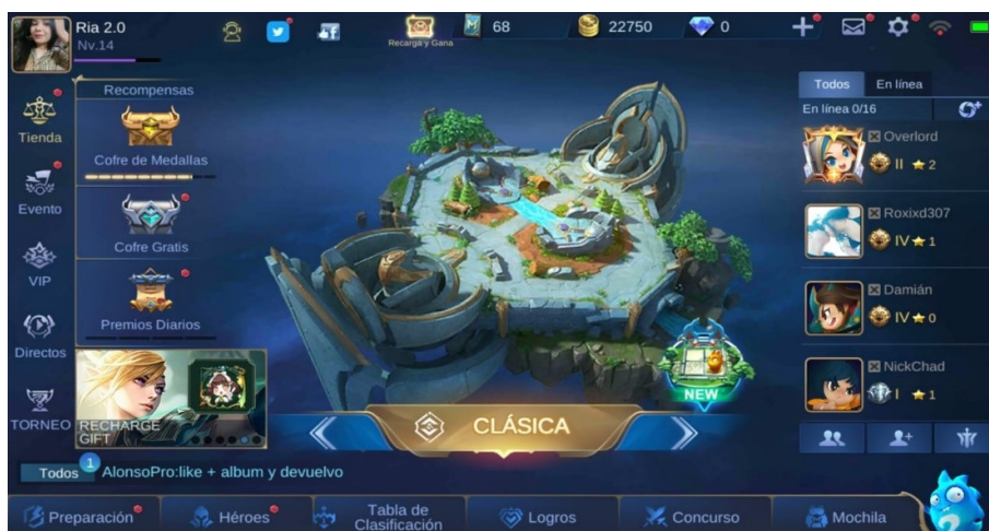
FIGURA 1 Figura 1. Modalidad clásica Mobile Legends

Fuente: Perfil propio implementado para la observación participante.