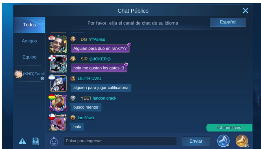
FIGURA 4 Búsqueda de mentor en chat público de Mobile Legends