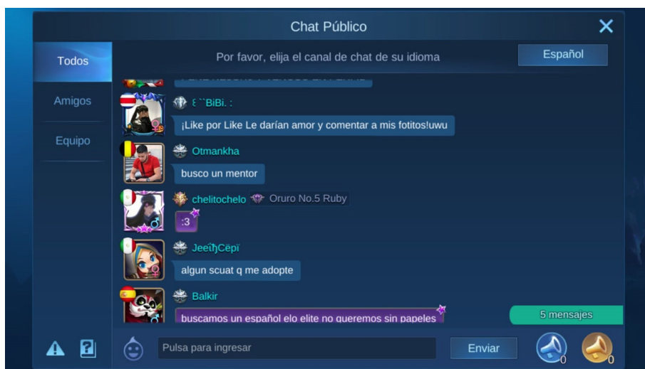
FIGURA 2 Petición de likes en chat público de Mobile Legends