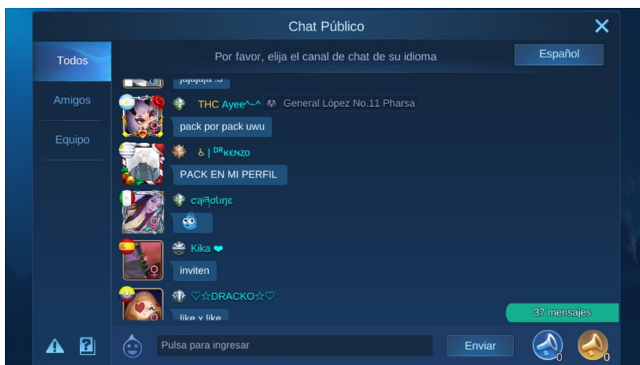
FIGURA 5 Solicitud de fotos íntimas en Mobile Legends