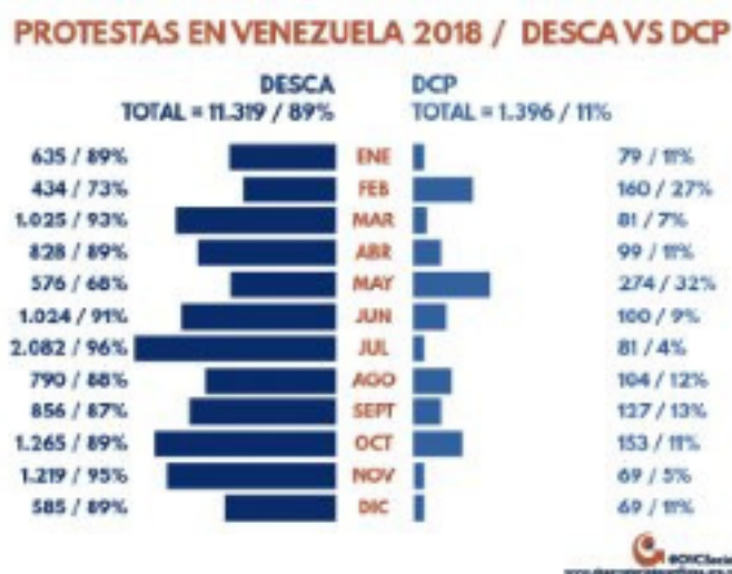
FIGURA 1 Protestas en Venezuela 2018