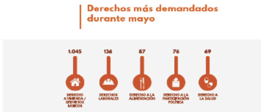
FIGURA 4 Derechos más demandados en Venezuela durante el mes de mayo de 2020

Por otra parte, 1.707 protestas, registradas en mayo de 2022, que representan un 26% de todas las documentadas, estuvieron relacionadas a Derechos Civiles y Políticos (DCP). Entre los más demandados fue el derecho a la vivienda y a los servicios básicos, tal como se puede observar en la Figura 4.