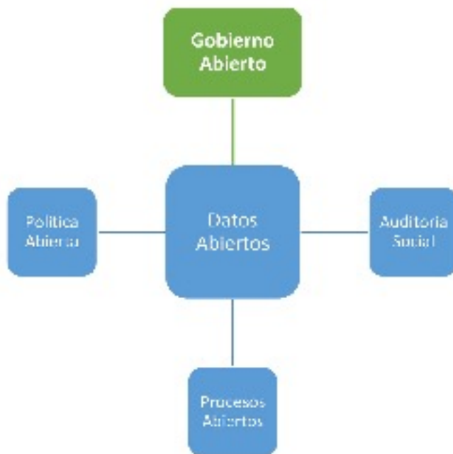
FIGURA 2 Tipología esquemática de Gobierno Abierto

Los datos abiertos son un dominio único del Gobierno Abierto (ver Figura 2), ya que son cruciales para el éxito de los otros tres dominios, y también un dominio separado propio. En otras palabras, la política abierta, el presupuesto abierto, la contratación abierta y la auditoría social no pueden tener éxito sino se sustentan en una política activa de intercambio de información y datos relevantes y transparentes con el público en general.