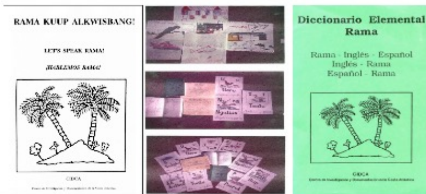
FIGURA 4 Materiales educativos para promover a lengua Rama