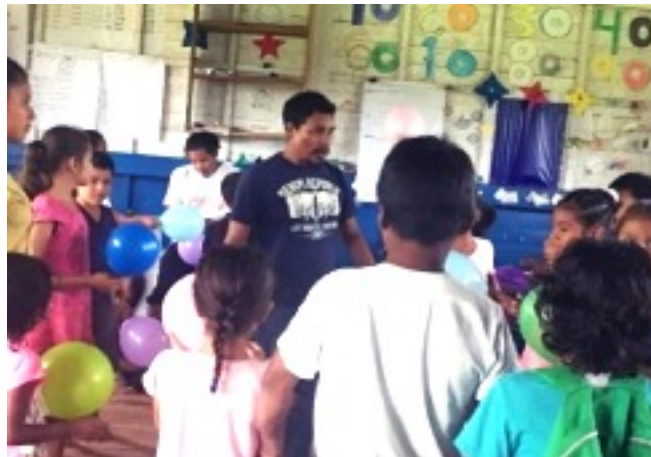
FIGURA 6 Actividades prácticas con los niños