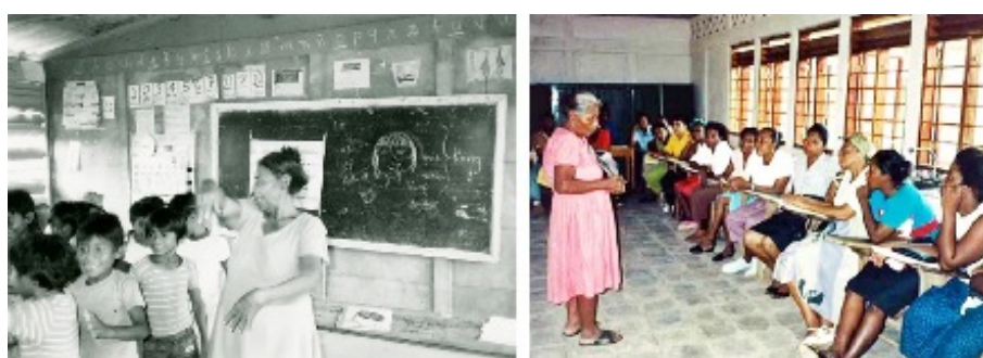
FIGURA 5 Actividades con los niños y talleres de lengua Rama en la URACCAN Bluefield