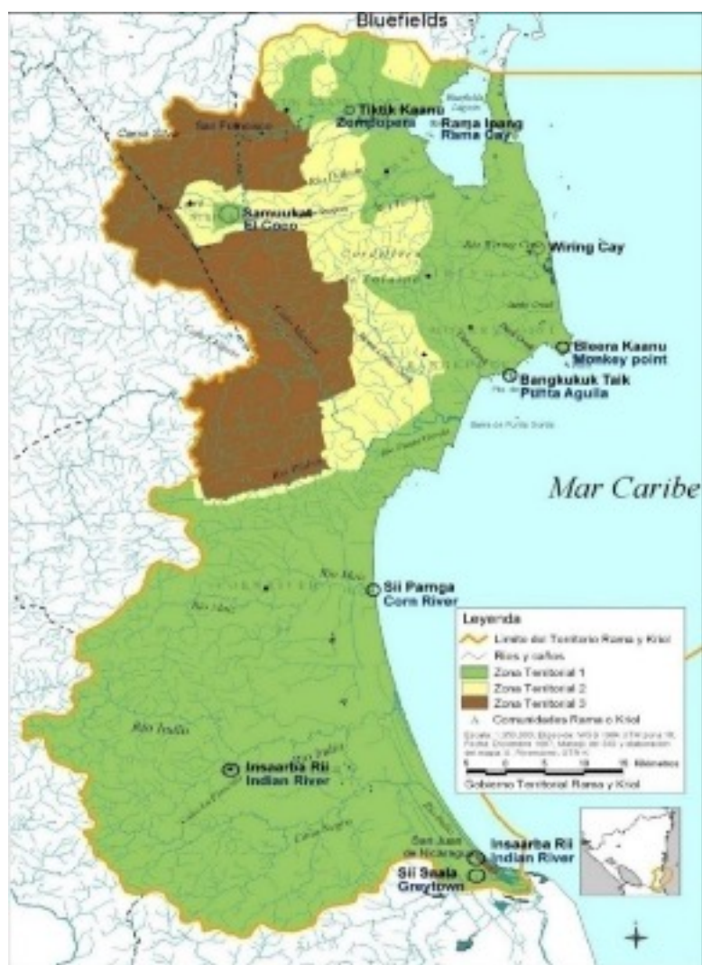
FIGURA 1 Mapa del territorio Rama