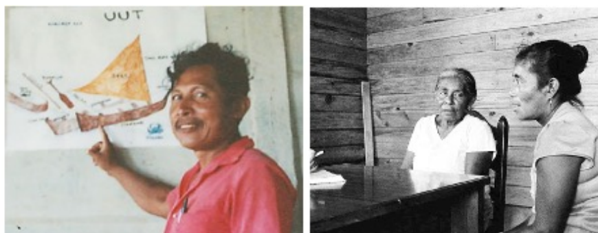
FIGURA 3 Hablantes nativos que formaron parte del proyecto

Figura 3. Hablantes nativos que formaron parte del proyecto