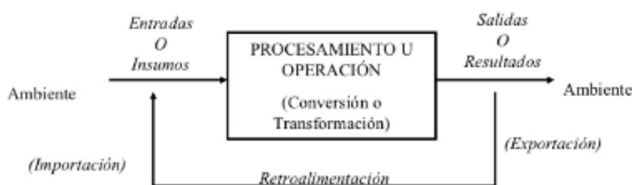
FIGURA 1 Organizaciones como sistemas