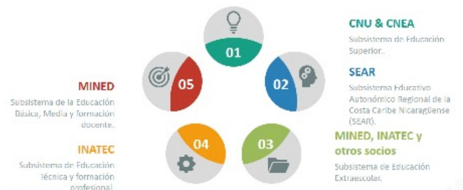
FIGURA 2 Subsistemas de la Educación en Nicaragua