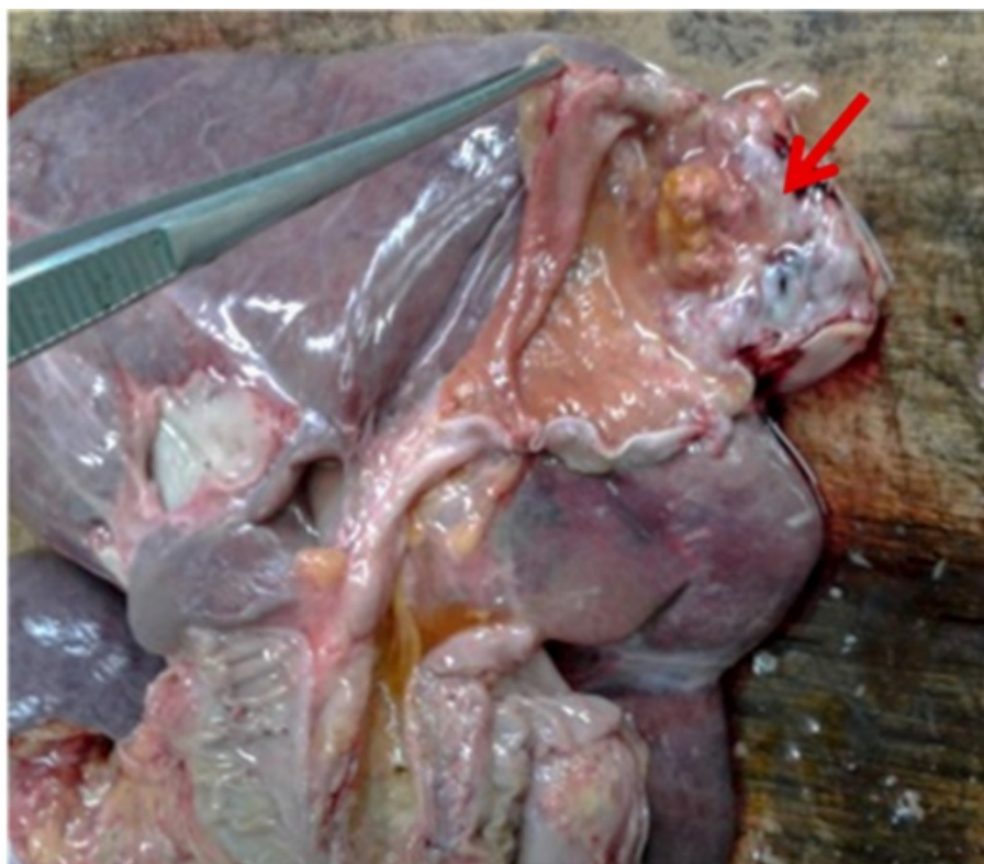
FIGURA 1. Tumor exofítico hacia el fondo de la vesícula biliar (flecha)

De los 10 casos con diagnóstico de cáncer de vesícula biliar, el 100% presento un tumor que macroscópicamente tenían un aspecto vegetante exofítico (Figura 1) e histológicamente se correspondieron con adenocarcinoma, siendo el 20% bien diferenciado (Figura 2) y el 80% moderadamente diferenciado. La variedad mucinosa, se presentó en el 40% de los casos. Es característico que un caso presentaba patrón papilar con extensa necrosis tumoral.