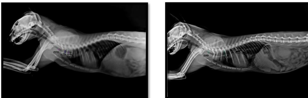
Radiografías torácicas del felino, vista lateral en inspiración y espiración. Se evidencia la disminución del diámetro en las distintas medidas.

Debido a estos hallazgos en la luz traqueal se optó por realizar una traqueoscopia, para lo cual se utilizó un baroscopio comercial para celular, debido a que el fibroscopio flexible que presentaba la institución era demasiado grande en su diámetro para el felino. Se observó que la laringe y toda la tráquea cervical y torácica hasta llegar a la carina se encontraban normales. No se logró visualizar la carina debido a que el baroscopio no podía progresar más allá de una zona de aspecto fibroso que obstruía casi por completo la luz traqueal y por momentos dicha luz se abría y cerraba. Se percibió que la reducción del diámetro no era normal debiéndose confirmar dicha presunción con una tomografía axial computada (TAC) debido al lugar donde estaba localizado el problema, inmediatamente a craneal de la carina bronquial.