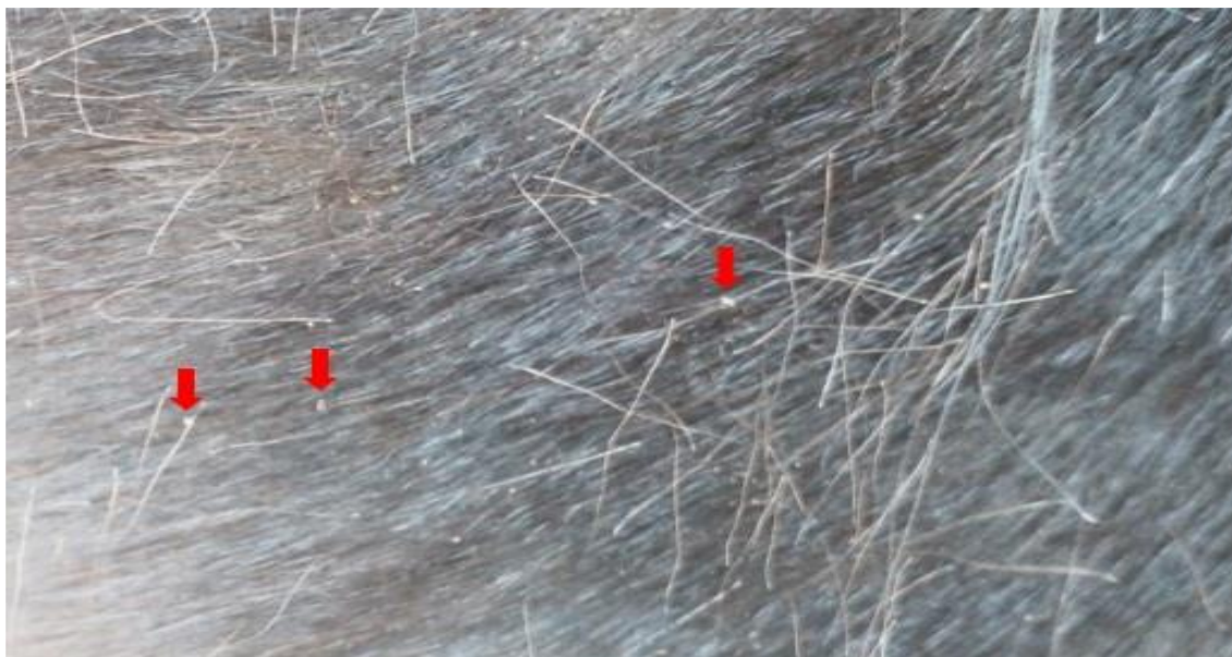
Presencia de piojos sobre la piel del equino (flecha roja)

Las muestras obtenidas en el examen clínico, fueron transportadas para su estudio al laboratorio de parasitología del Instituto de Investigación Animal del Chaco Semiárido (IIACS) con sede en INTA Salta. El procesamiento de los parásitos consistió en una decoloración con Lactofenol y posterior observación al microscopio óptico simple para su identificación taxonómica siguiendo las claves descriptas por Price y Graham (1997) (12) .