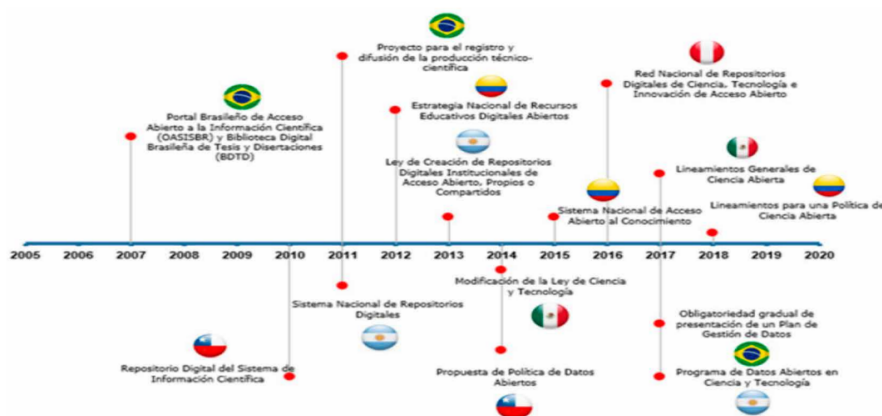
Figura 3. Hitos en el desarrollo de acciones de CA en los países de Latinoamérica (De Filippo & D’Onofrio, 2019).