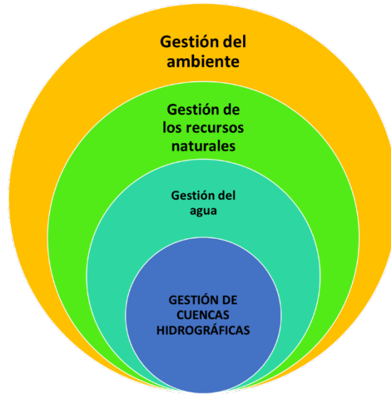
Figura 2. Jerarquización de acciones de gestión a nivel de cuenca. Fuente: Adaptado de Dourojeanni, Jouravlev y Chávez, (2002).

A partir de la recopilación y revisión del marco teórico presentado anteriormente para abordaje del manejo integrado de cuencas, a continuación, se expone un caso de estudio como resultado de aplicación como la metodología descripta, resaltando aspectos ambientales e institucionales de dicha cuenca.