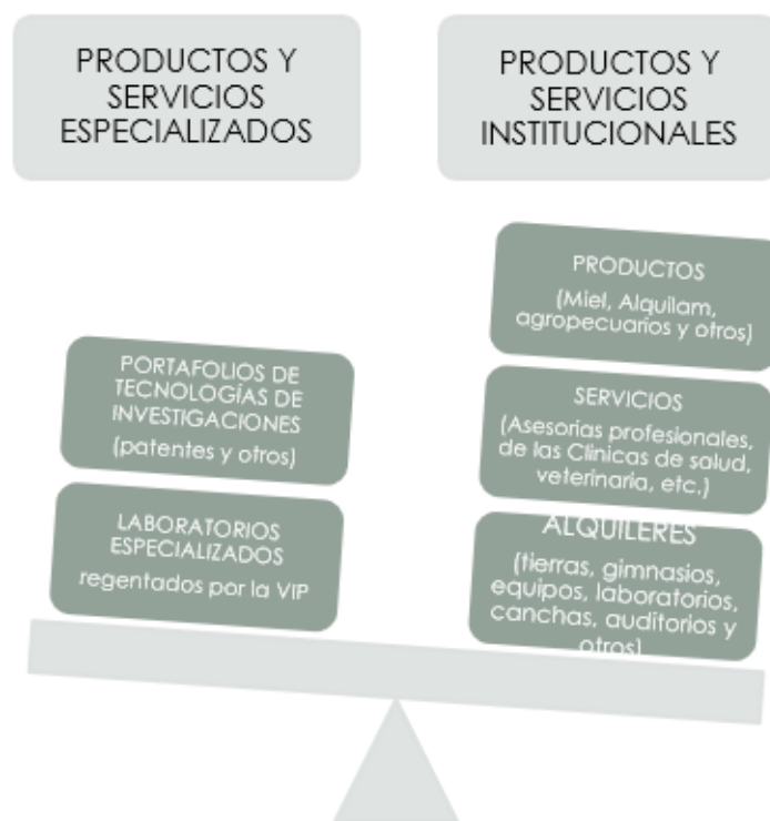
Figura #1 J.

Desde estas reflexiones, se llama la atención a la comunidad universitaria, a realizar mayores investigaciones y gestiones para retomar la discusión para el establecimiento de las políticas, formalizar la reglamentación, ejecución y gestión de un sistema de aprovechamiento de estos productos y servicios universitarios que actualmente no se explotan comercialmente en beneficio de la Universidad de Panamá y sus emprendedores universitarios.