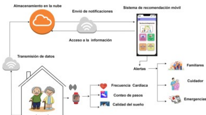
FIGURA 2. Arquitectura del sistema propuesto

Dado el interés y la importancia de la tecnología en el ámbito del desarrollo de software de calidad, ha surgido la idea de diseñar una arquitectura con componentes tecnológicos que mejoren la calidad de vida de los adultos mayores [25]–[29]. La figura 2 muestra visualmente la concepción principal de nuestra arquitectura integral.