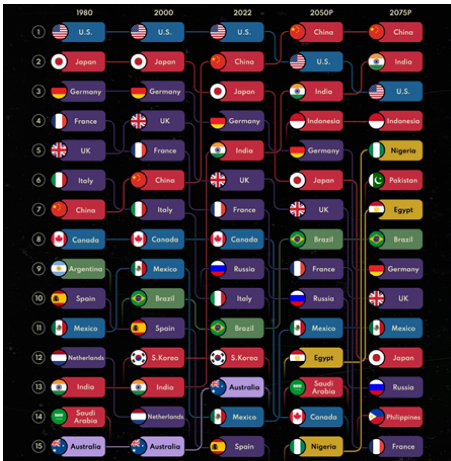
FIG. NO. 1