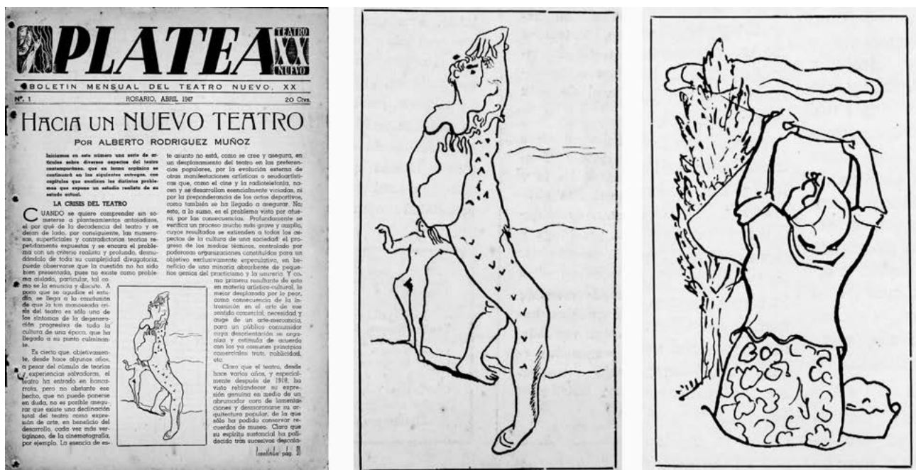
Figura 2. Platea . Boletín mensual del Teatro Nuevo XX, Rosario, 1947. Ilustraciones de Pedro Gianzone.

A la vez que intentaba subvertir las normas estandarizadas del movimiento histórico, 13 Rodríguez Muñoz propuso un repertorio escénico variado con obras provenientes en mayor medida de la literatura europea y norteamericana. Las primeras representaciones se realizaron en el Teatro La Ópera y en algunos casos se ejecutaron funciones en centros educativos hasta la adquisición de un local propio. El programa de 1942 incluyó El cartero del rey , de Rabindranath Tagore, Detrás del mueble , de Roger Plá, —que inauguró las sesiones de teatro polémico en las que se debatía con el público, el director y los intérpretes—, e Interior de Maurice Maeterlinck. 14 Junto con estas primeras obras, desde 1943 publicaron una revista llamada Expresión y realizaron audiciones radiales en las que participaron los actores junto a los artistas plásticos y escritores que formaban parte del grupo. Se buscó inundar todo el escenario con un conjunto de propuestas culturales de carácter pedagógico que iban desde las manifestaciones públicas en los diarios y conferencias en instituciones de la ciudad hasta la publicación de revistas y boletines ilustrados por artistas. 15 (Ver figura 2) A esto se sumaban actividades radiales, conciertos de música, seminarios de estudio, exposiciones de artistas y antologías orales de poetas contemporáneos,