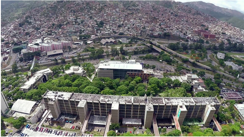
Figura 1. Campus universitario UCAB Montalbán