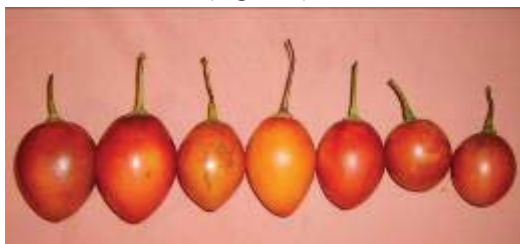
Figura 1. Frutos de las variedades de tomate de árbol: morado gigante, amarillo gigante, morado puntón, amarillo puntón, amarillo puntón y amarillo bola.

Solanum betaceum o tomate de árbol es un arbusto endémico de la región oriental de los Andes [1]. Se caracteriza por su fruto ovoide o redondeado, dependiendo de la variedad. Su mesocarpio es de color amarillo, morado o tomate, con cáscara lisa y gruesa variando su color de rojo a amarillo [2]. Albornoz y Cadena, por estudios fenotípicos reconocen que en Ecuador existen 5 variedades. Dos variedades similares a las que debieron ser las primeras plantas de tomate de árbol domesticadas, (amarilla y negra), una tercera variedad “Criollo”, dividida en dos subvariedades, (puntón y redondo), y una quinta variedad roja [3,4]. En esta investigación se usa las variedades que distingue el agricultor y que resultan de la combinación de dos caracteres del fruto: color (amarillo o morado) y forma (puntón, gigante o bola), dando un total de 6 posibles variedades (Figura 1).