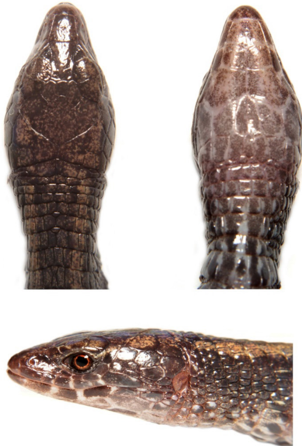
FIGURA 4. Detalle de la cabeza en vista dorsal, ventral y perfil del alotipo de Andinosaura kizirani (MZUA.RE.0287).