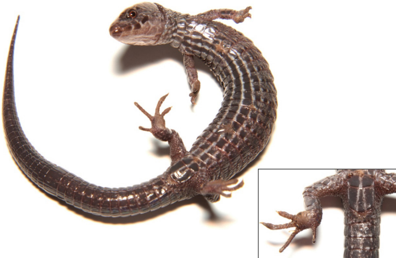
FIGURA 3. Vista ventral y detalle de la placa cloacal (recuadro inferior) del alotipo de Andinosaura kiziriani (MZUA.RE.0287).