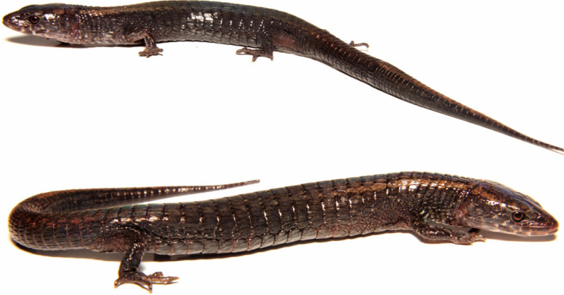
FIGURA 2. Alotipo de Andinosaura kiziriani hembra (LRC= 66,1mm)