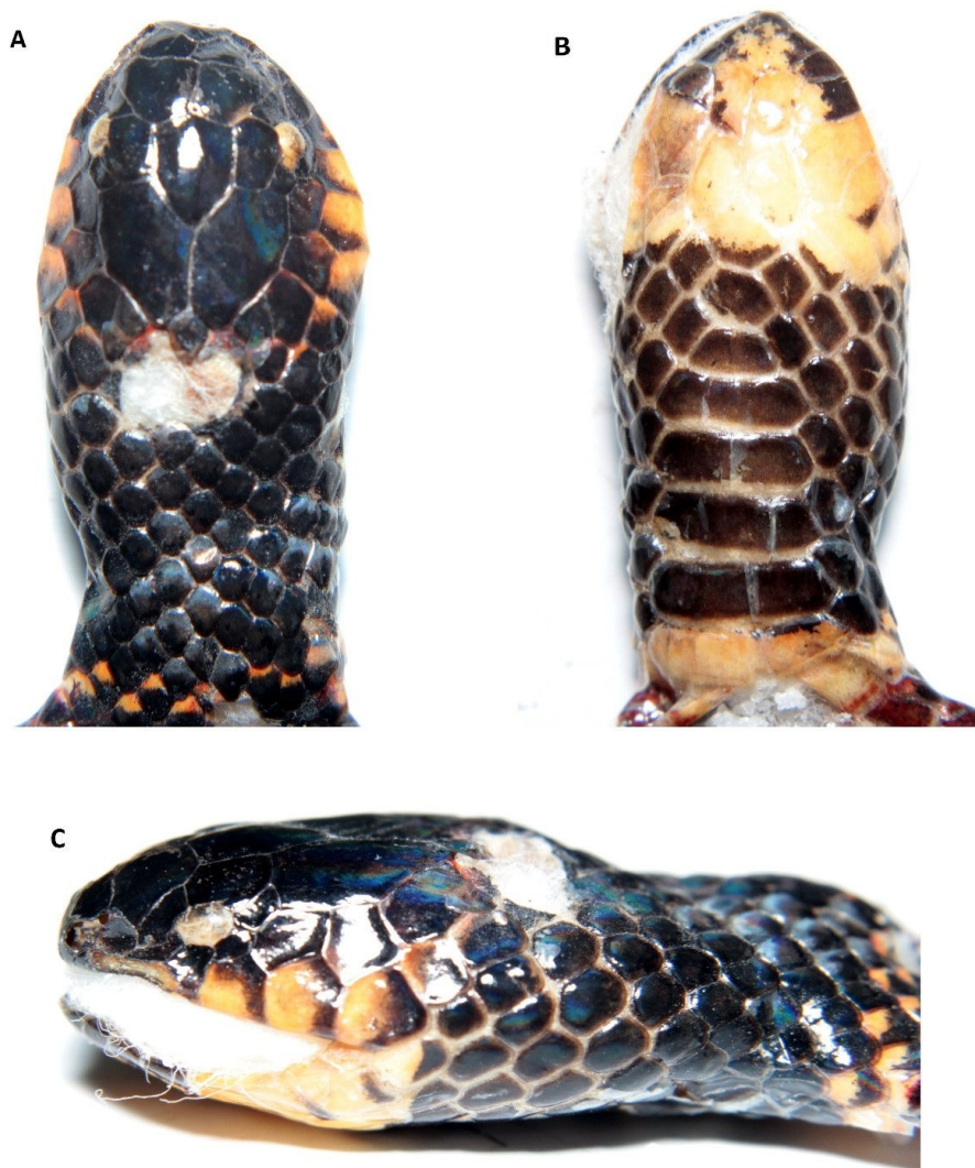
Figura 2: Detalle de la cabeza de Micrurus steindachneri (MZUA.RE 0371, macho). A) dorsal, B) ventral, C) perfil.