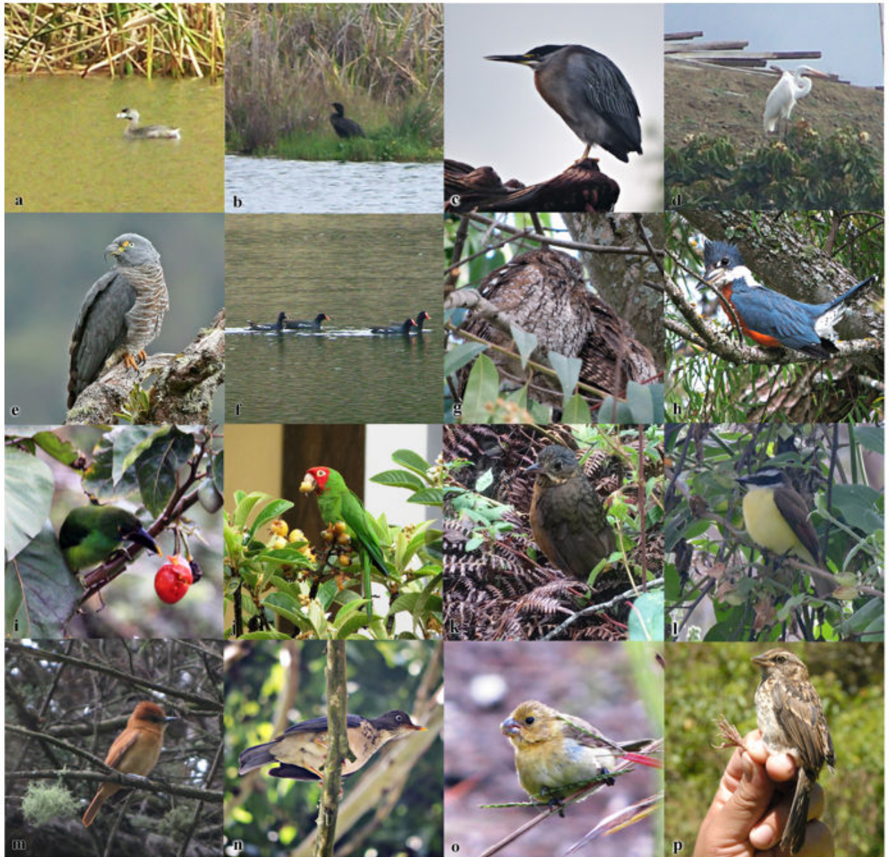
Figura 2: a) Pied-billed Grebe Podilymbus podiceps , Carigán, Loja, Ecuador, Abril 2011 (D. Carrión); b) Neotropic Cormorant Phalacrocorax brasilianus , Carigán, Loja, Ecuador, Abril 2011 (M. Barrera); c) Striated Heron Butorides striata , Jipiro, Loja, Ecuador, Agosto 2015 (A. Orihuela-Torres); d) Great Egret Ardea alba , Carigán, Loja, Ecuador, Abril 2011 (M. Barrera); e) Hook-billed Kite Chondrohierax uncinatus , Cajanuma, Parque Nacional Podocarpus, Loja, Ecuador (R. Ahlman); f) Common Gallinule Gallinula galeata , Carigan, Loja, Ecuador, Abril 2011 (D. Carrion); g) West Peruvian Screech Owl Megascops roboratus , Campus Universidad Técnica Particular de Loja, Loja, Ecuador (L. Ordóñez-Delgado); h) Ringed Kingfisher Megaceryle torquata (hembra), Jipiro, Loja, Ecuador (A. Orihuela-Torres); i) Emerald Toucanet Aulacorhynchus prasinus , El Capulí, Loja, Ecuador (H. Lucero). j) Red-masked Parakeet Psittacara erythrogenys , Centro de la ciudad de Loja, Ecuador (L. Ordóñez-Delgado); k) Scaled Antpitta Grallaria guatemalensis , Parque Universitario PUEAR, Universidad Nacional de Loja, Loja, Ecuador (L. Cueva); l) Great Kiskadee Pitangus sulphuratus , Jipiro, Loja, Ecuador (A. Orihuela-Torres); m) One-colored Becard Pachyramphus homochrous , Parque Universitario PUEAR, Universidad Nacional de Loja, Loja, Ecuador (L. Ordóñez-Delgado); n) Plumbeous-backed Thrush Turdus reevei , Parque Jipiro, Loja, Ecuador (A. Orihuela-Torres); o) Variable Seedeater Sporophila corvina , Parque Universitario PUEAR, Universidad Nacional de Loja, Loja, Ecuador (L. Ordóñez-Delgado); p) Tumbes Sparrow Sporophila corvina , Quebrada Volcán, parte alta de Jipiro (D. Armijos).