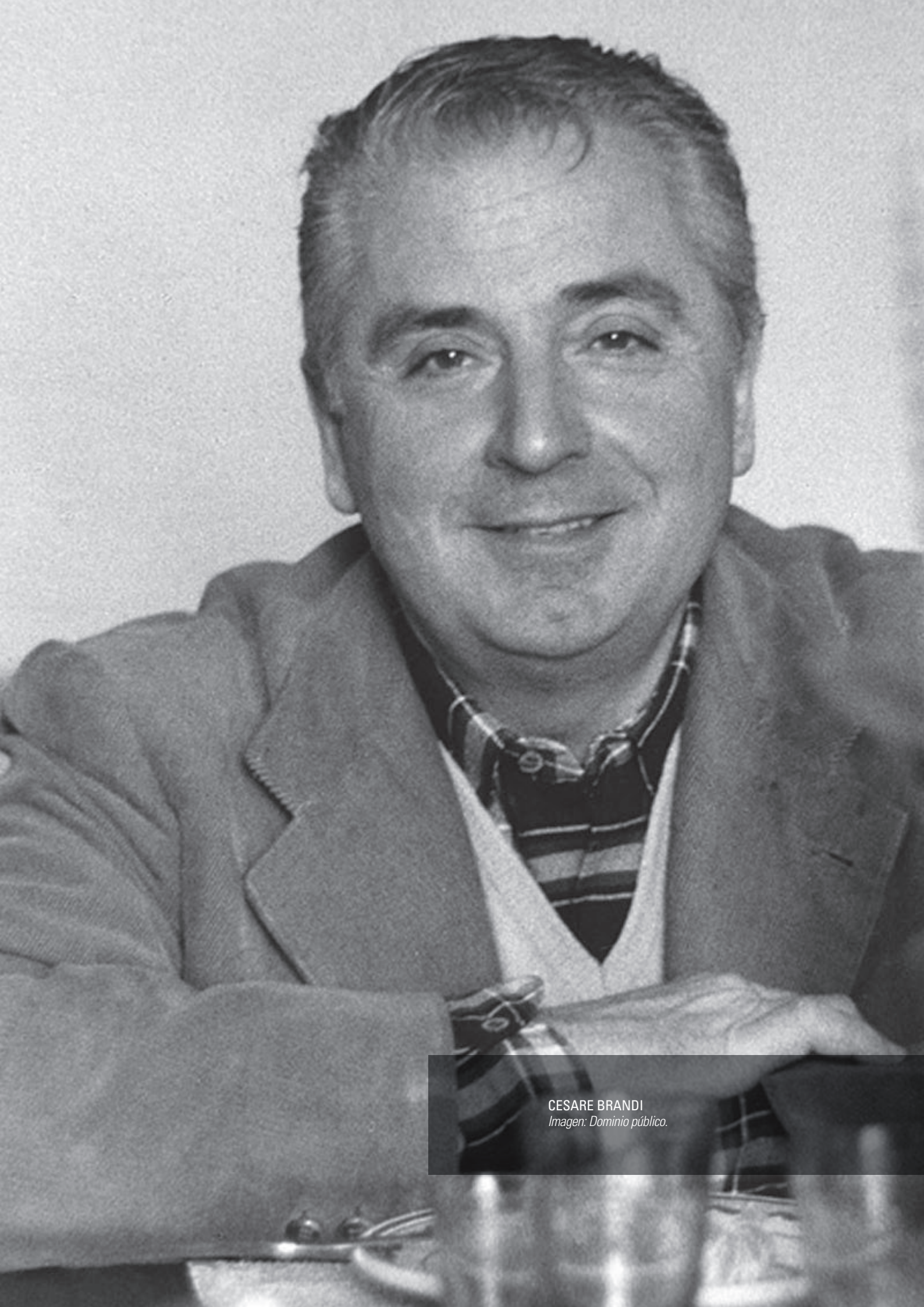
CESARE BRANDI