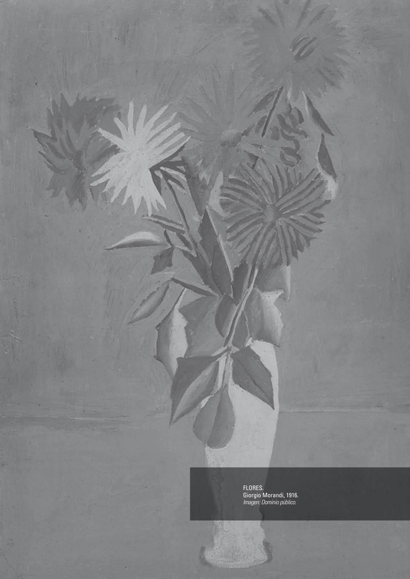
FLORES. Giorgio Morandi, 1916.