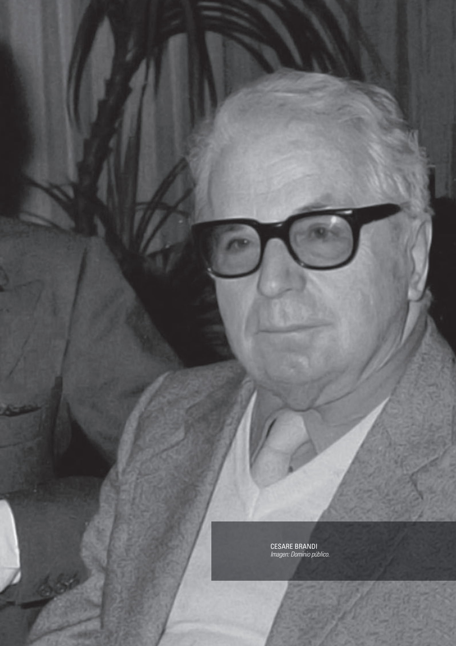
CESARE BRANDI