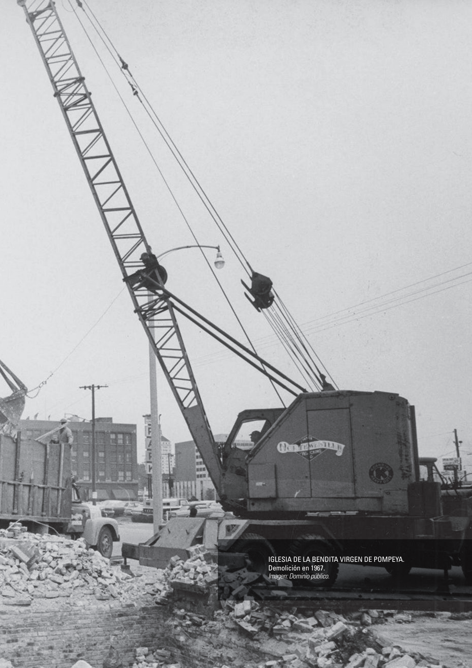
IGLESIA DE LA BENDITA VIRGEN DE POMPEYA. Demolición en 1967.