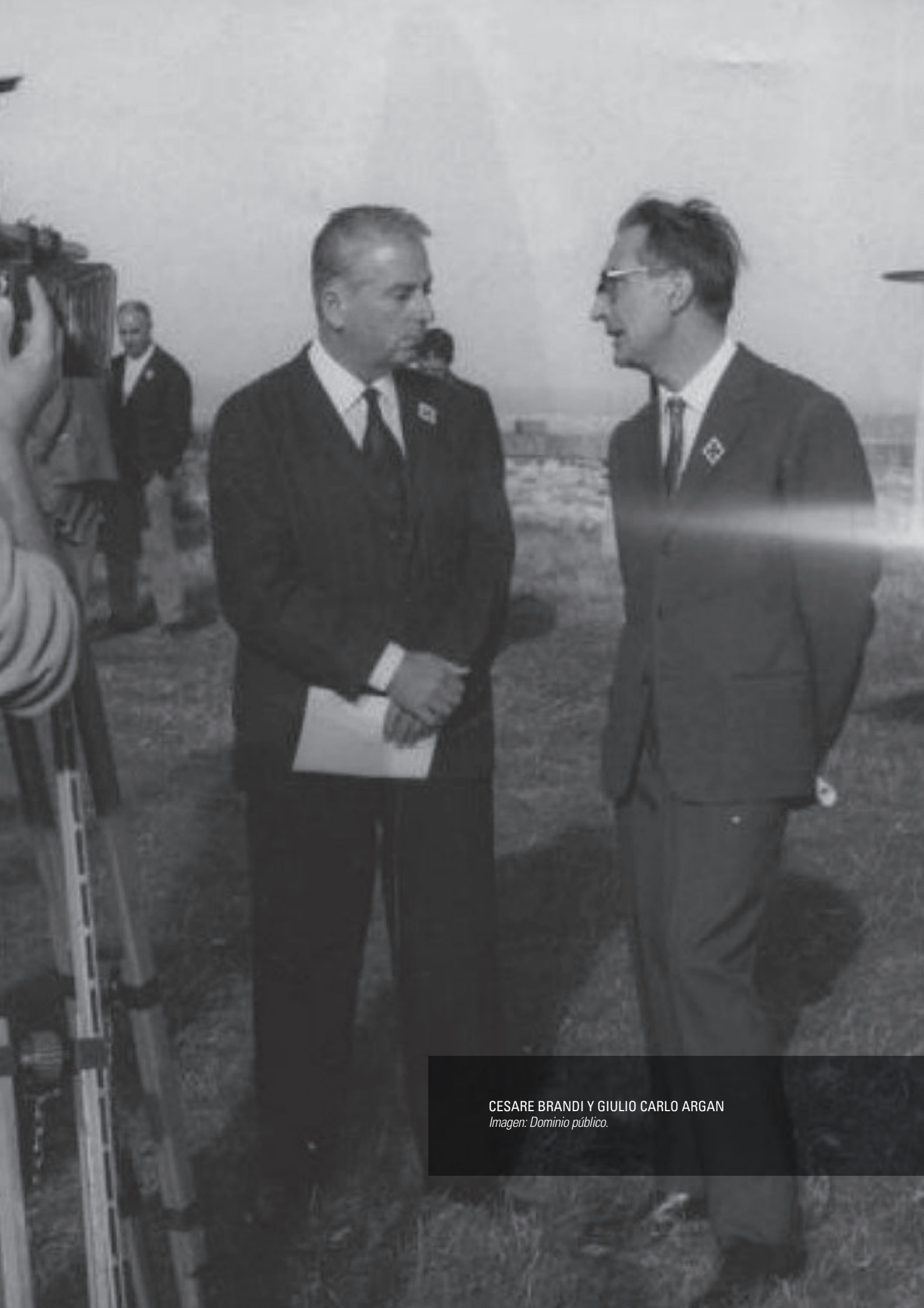
CESARE BRANDI Y GIULIO CARLO ARGAN