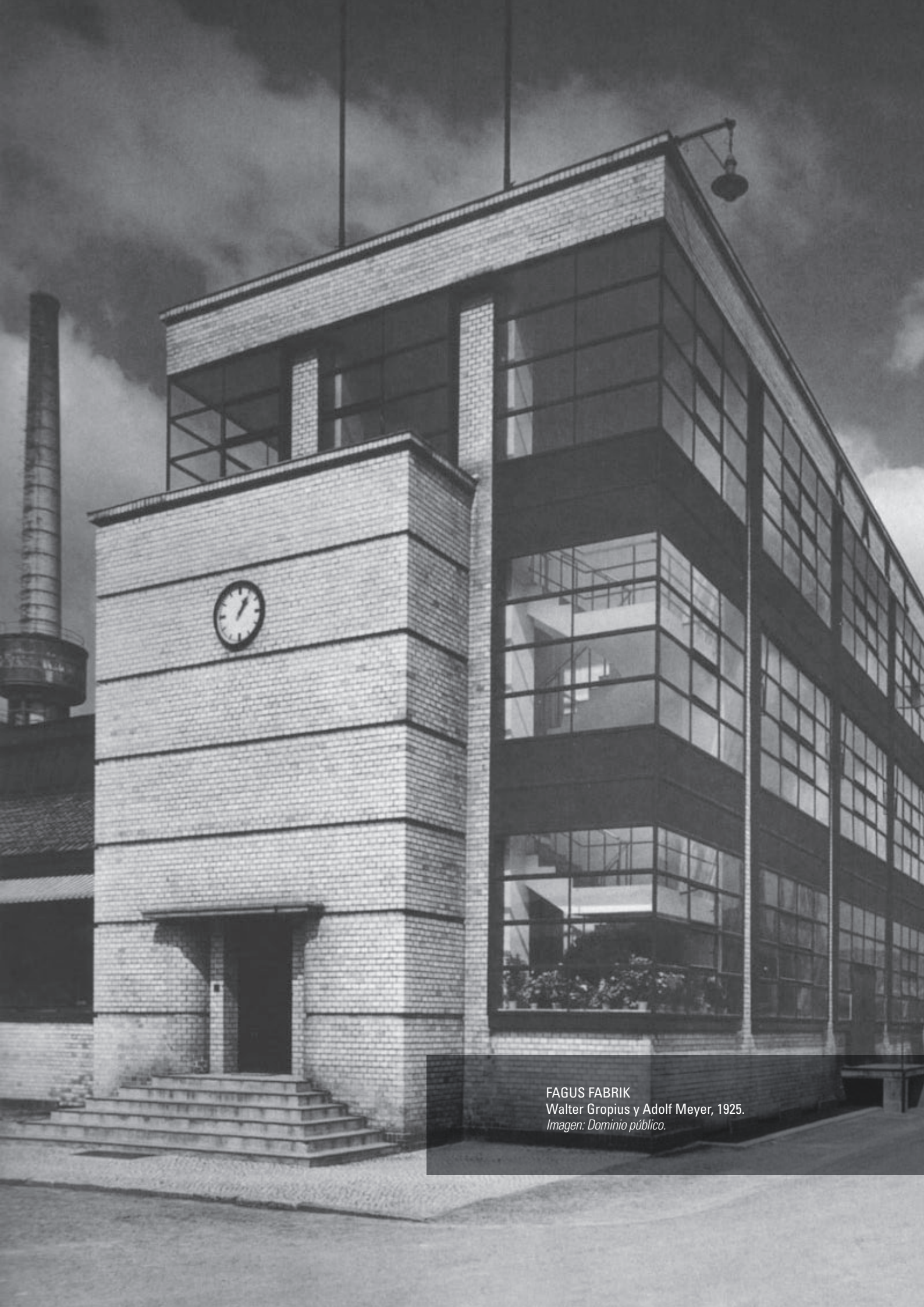
FAGUS FABRIK Walter Gropius y Adolf Meyer, 1925.