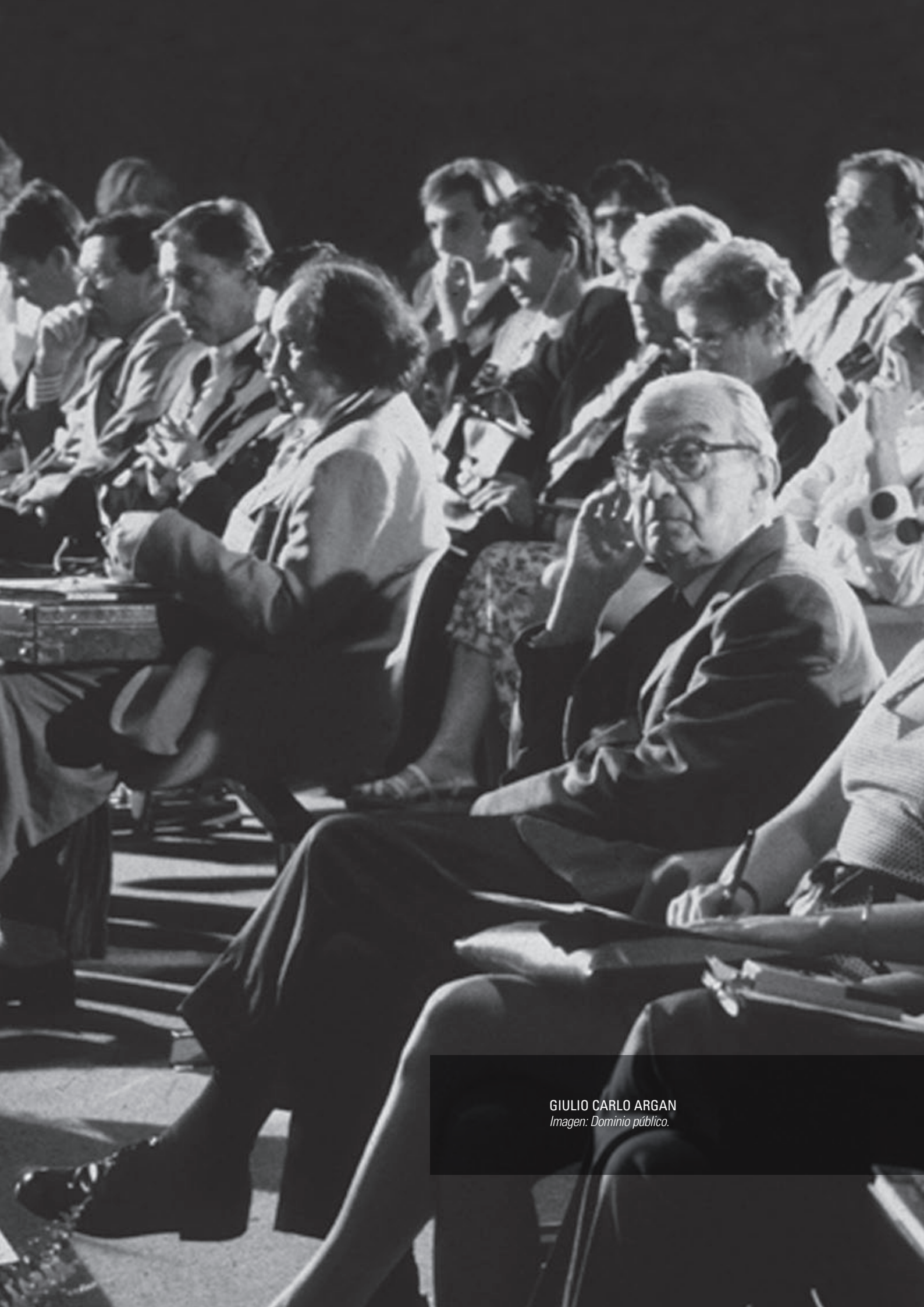
GIULIO CARLO ARGAN