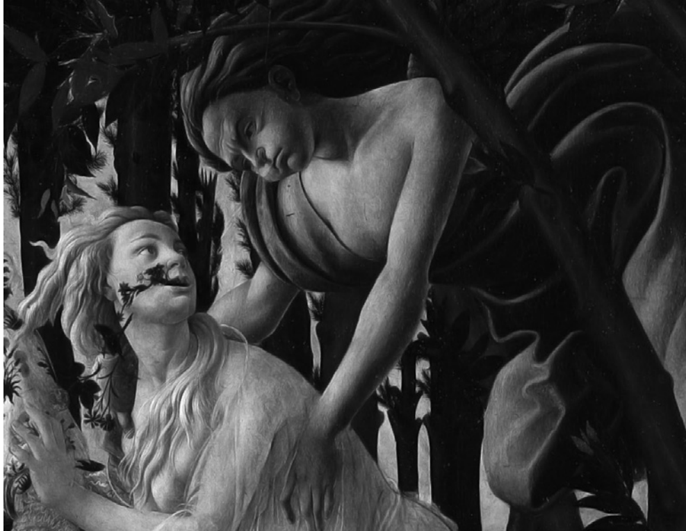
ALEGORÍA DE LA PRIMAVERA. Detalle. Sandro Botticelli, 1478 a 1482. Galería de los Uffizi, Florencia.