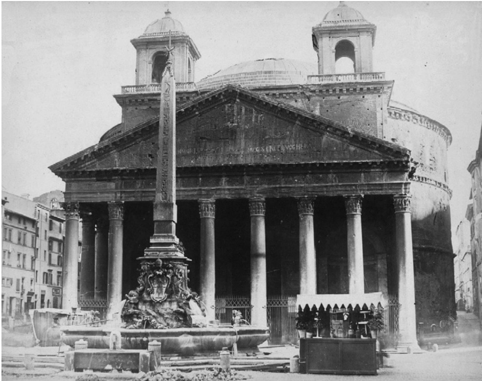
PANTHEON. Roma, ca. 1860.

Nessuno penserebbe di modificare la lezione risultata spuria o comunque interpolata in un codice dantesco sul codice stesso: ma, se noi togliamo le orecchiette del Pantheon, modifichiamo per sempre il testo storico di un'opera, anche se è per ricondurlo alla lezione originaria.