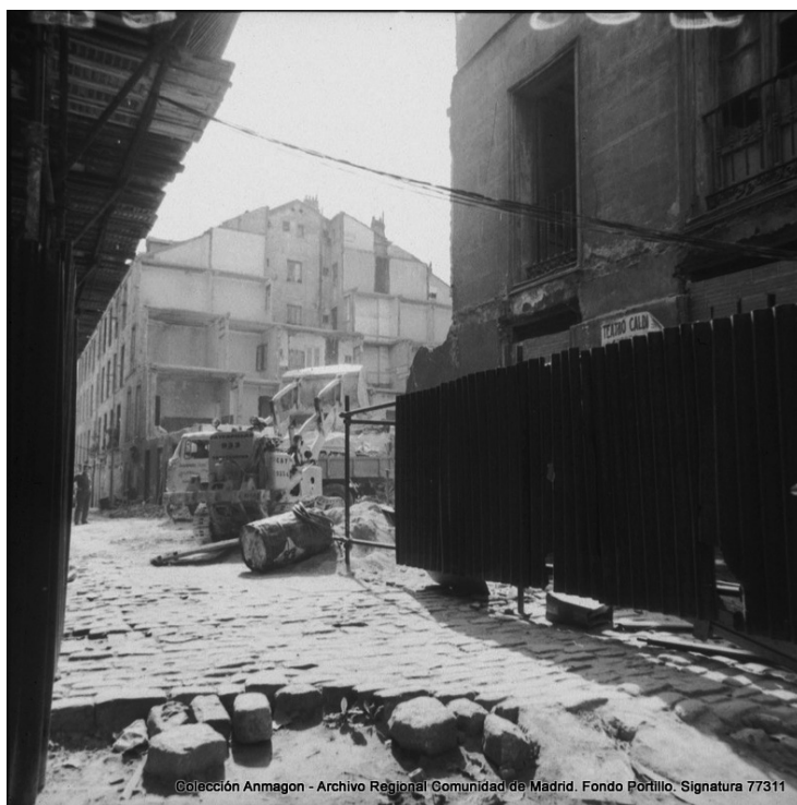
FIGURA 3B. VISTA DE LA CALLE DE HERMOSA, EN EL BARRIO DE LAS POZAS, MADRID, DURANTE EL PROCESO DE DERRIBO DE LAS VIVIENDAS, OCTUBRE 1969.