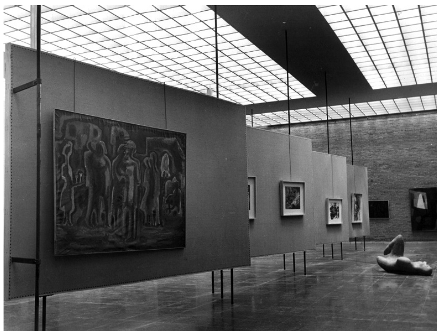
FIGURA 6. VISITA DE UNA SALA DEL MUSEO NACIONAL DE ARTE CONTEMPORÁNEO EN 1959, CUANDO ERA DIRECTOR DE ESTA INSTITUCIÓN EL ARQUITECTO FERNANDO CHUECA GOITIA.

Sin duda, estas opiniones, expresadas en una época en la que progreso y modernidad eran sinónimos, granjearon a Chueca la enemistad de una parte importante de los arquitectos contemporáneos, dando pie a la imagen de conservador y tradicionalista a ultranza que tiene todavía hoy, una idea que choca con la modernidad artística que defendió durante diez años (de 1958 a 1968), desde su puesto como crítico de arte y director del Museo Español de Arte Contemporáneo en una etapa muy comprometida del mismo (Jiménez-Blanco, 1989: 112). Al frente de esta institución, además de impulsar la realización de una guía del museo (Chueca Goitia, 1962), Chueca promovió importantes exhibiciones de renombrados artistas, como la exposición internacional de grabados de Picasso (1961), 29 la primera del artista en nuestro país desde la Guerra Civil, o la muestra La nueva pintura americana con fondos del MOMA de Nueva York, exhibidas por primera vez en nuestro país ( ABC , 1958), sin olvidar otras importantes, como la colección de George Labouchere, que incluía obras radicalmente modernas de Dubuffet, Max Ernst, H. Moore, Barbara Hepworth, Hartung, Saura, Pablo Serrano, entre otros (1965), o la muestra dedicada a los artistas españoles en la Escuela de París (1969) (Figura 6).