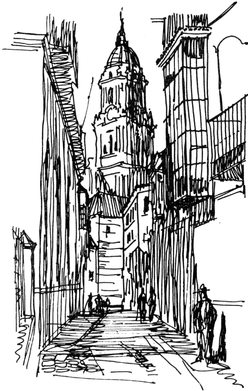
FIGURA 4. MÁLAGA, EJEMPLO DE CIUDAD TRADICIONAL. Apunte del centro histórico, realizado por Chueca Goitia y publicado en su obra Breve historia del urbanismo (Madrid, 1968).

Y una polémica idea desde los parámetros actuales (también en su tiempo), que fue expuesta por Chueca en marzo de 1968, en una conferencia celebrada en la Facultad de Filosofía y Letras de la Universidad de Granada, por invitación de la asociación cultural Granada Nuestra (Chueca Goitia, 1968), pero que no era nueva en nuestro país.