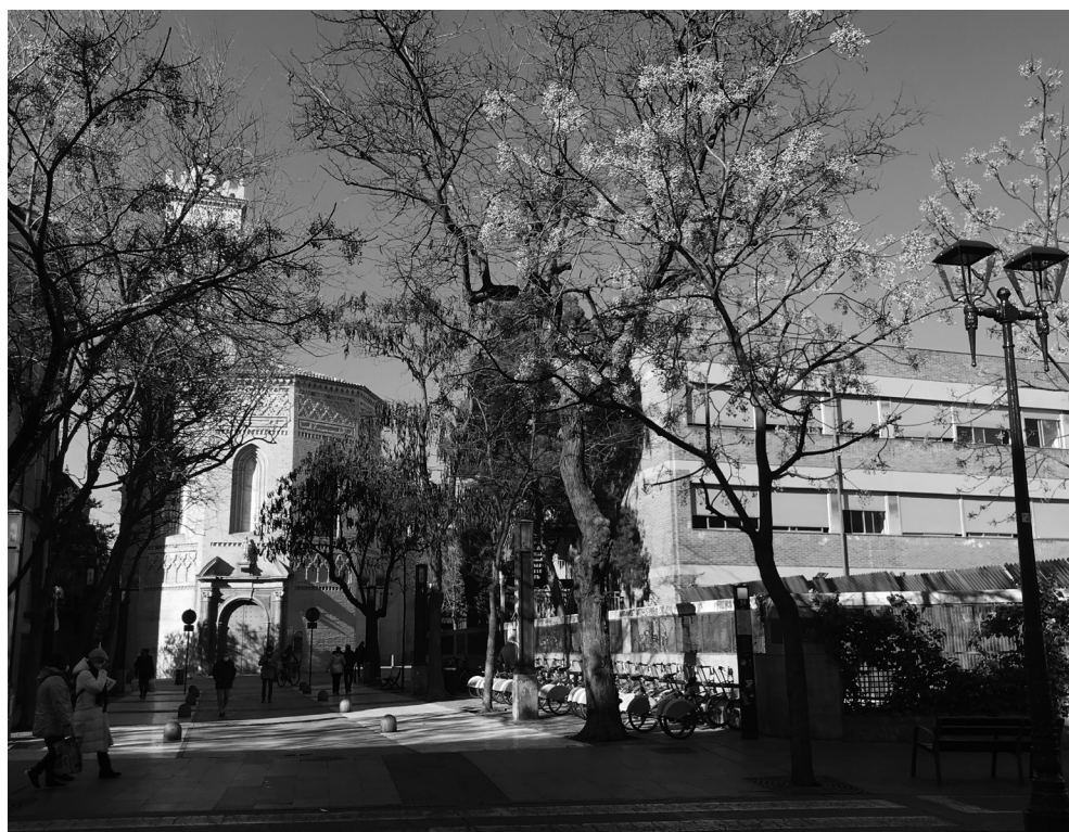
FIGURA 5. UN TRISTE EJEMPLO DEL EFECTO DEL DESARROLLISMO EN LAS CIUDADES ESPAÑOLAS: LA DESTRUCCIÓN DE LA ANTIGUA UNIVERSIDAD LITERARIA, SITUADA EN LA PLAZA DE LA MAGDALENA, ZARAGOZA. 5a. Edificio original en 1910. 5b. La Universidad en una postal de los años 60. 5c. Demolición en 1968 de la histórica construcción, la más antigua de la Universidad de Zaragoza, que se remontaba a finales del siglo XV, con una importante reforma a comienzos del siglo XX. 5d. Estado actual de la plaza con el instituto de enseñanza secundaria, levantado por el Ministerio de Educación en 1973.