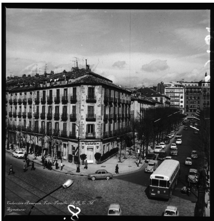
FIGURA 3A. VISTA DE LA CALLE PRINCESA CON ALBERTO AGUILERA, EN EL BARRIO DE LAS POZAS, MADRID, ANTES DE SU DESTRUCCIÓN, 1969.