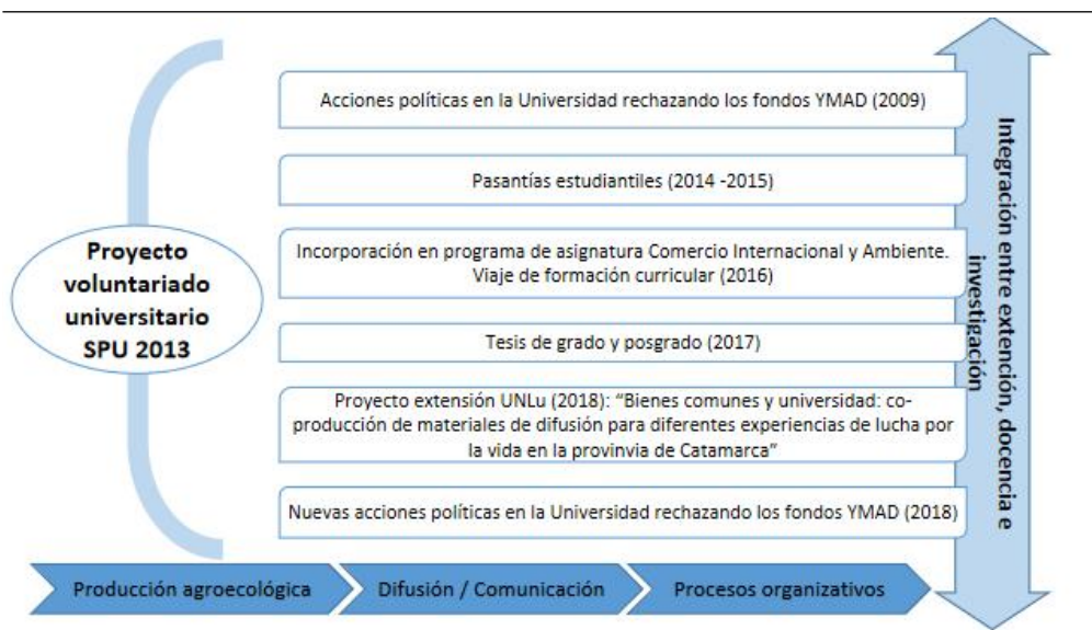
Figura 1. Síntesis de la experiencia “En defensa del agua, el cerro y la vida en la provincia de Catamarca”

El primer recorrido referencia el trabajo con la Asamblea de Tinogasta Darío Moreno en el marco del conflicto socioambiental debido a la resistencia al avance de la explotación minera a cielo abierto en el Valle del río Abaucán (Tinogasta, Catamarca). La Figura 1 esquematiza esa trayectoria.