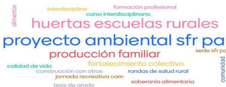
Figura 3: Nube de palabras de los hitos EFI 2012–2019

nificativos de los EFI 2012–2019”. Esta técnica recoge a modo de lluvia de ideas los hitos percibidos de forma subjetiva, definiéndose en función del objetivo de este trabajo. Entre ambas metodologías es posible contextualizar los hitos al identificar las fechas en que se dieron, quiénes participaron y, sintéticamente, qué fue lo que sucedió. Para contemplar en cada uno las distintas dimensiones de la acción humana: “el hacer, el sentir y el pensar” (Bertrutti, Cabo, Dabezies, 2012, p. 82), se elaboró una encuesta en formato Google docs con la finalidad de rescatar la experiencia de los estudiantes de Nutrición que transitaron por el EFI.