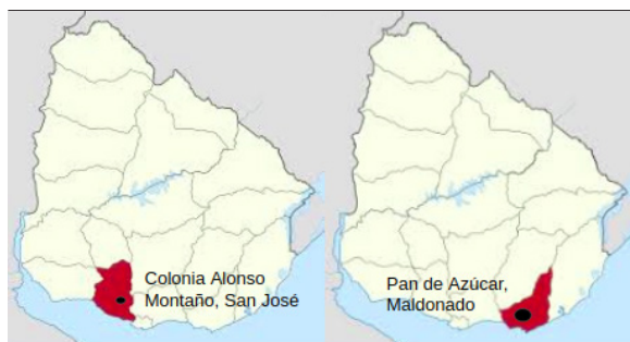
Figura 1: Ubicación de los territorios rurales