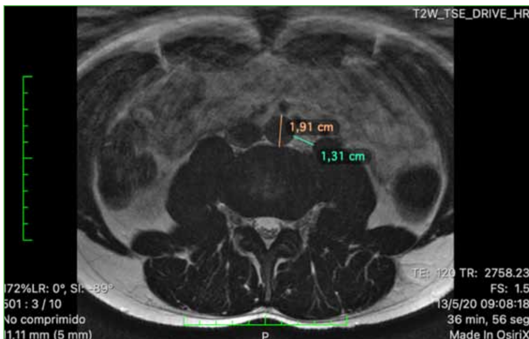
Figura 2. Resonancia magnética del disco intervertebral, corte axial, donde se ejemplifican las mediciones. Para la distancia arteria-disco, es el punto más anterior de la arteria hasta el punto más anterior del disco intervertebral. Para el corredor aorto-psoas, se toma el punto más lateral de la arteria hasta el punto más medial del músculo psoas.