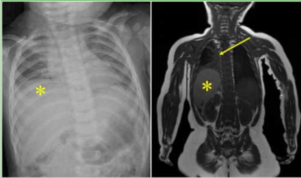
Figura 2. Radiografía de tórax, de frente y resonancia magnética de cuello y tronco, corte coronal. Parálisis del hemidiafragma derecho por compromiso del nervio frénico relacionado con la metámera C4. Nótese la elevación del hígado (asteriscos amarillos), el colapso del pulmón y las atelectasias (flecha amarilla).