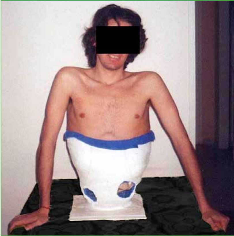
Figura 6. Confección de la cesta de yeso con apoyo plano.