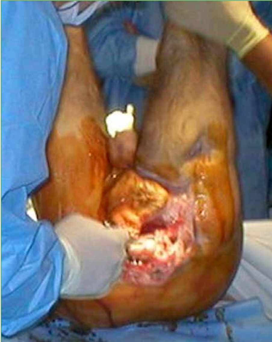
Figura 3. Escara sacra.

La cirugía comenzó con el paciente en decúbito dorsal y un abordaje ilioinguinal bilateral ampliado a proximal con la finalidad de crear un colgajo anterior que luego cubra el defecto posterior (Figura 4). Incluyó una colostomía y una ureteroileostomía. Se procedió a la ligadura de la vena cava y de ambas arterias ilíacas comunes. Se disecó y ligó el plexo de Batson y se realizó la desarticulación en L3-L4. Se administró lidocaína al 1% intraneural para evitar el shock neurológico y se efectuó la resección de las raíces con electrobisturí bipolar. La duramadre se cerró con Prolene 6-0 y dicho cierre se confirmó mediante maniobras de Valsalva.