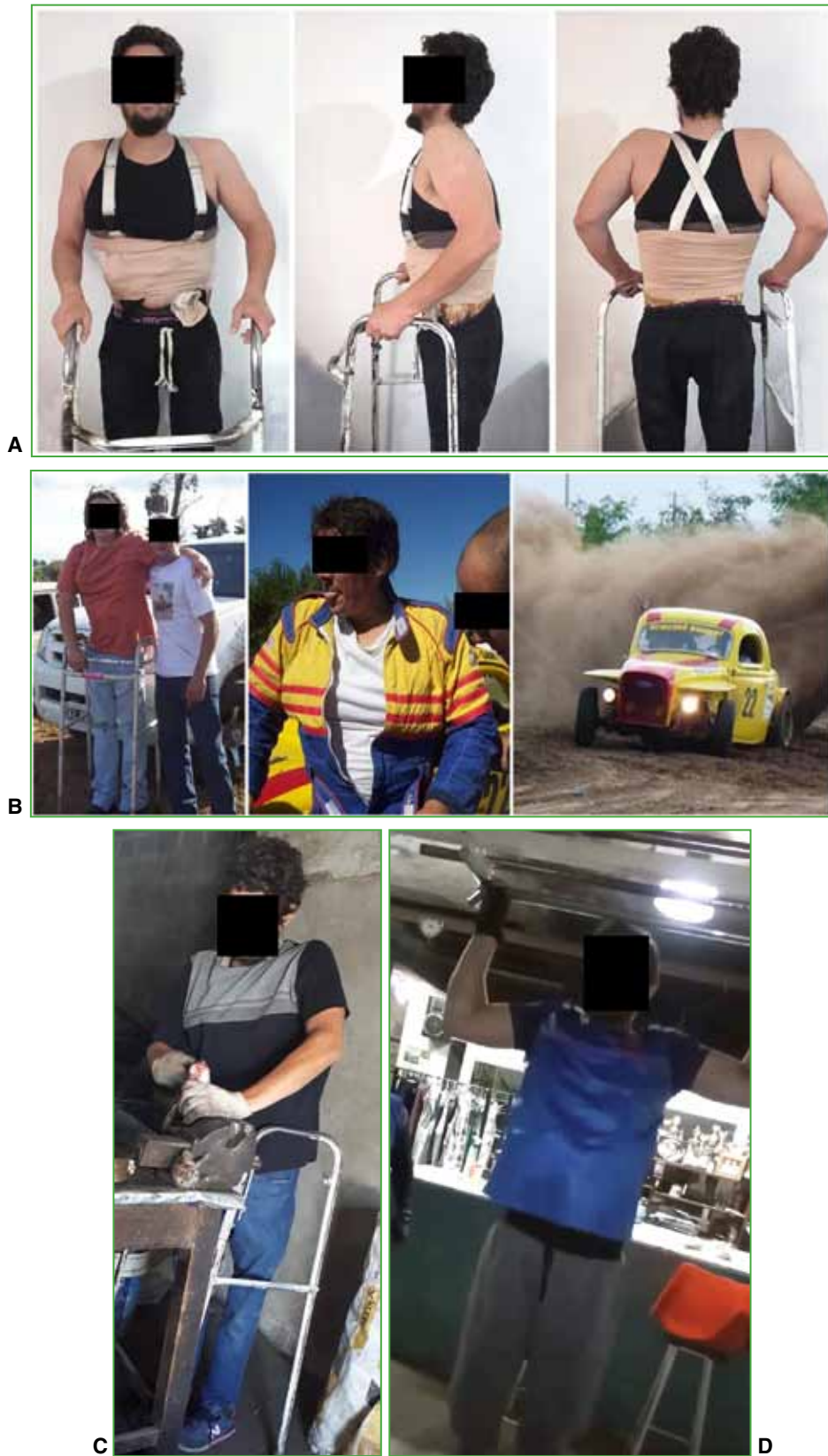
Figura 10. A. Estado actual del paciente con un andador. B. En competencias automovilísticas. C. Trabajando en su taller. D. En el gimnasio.