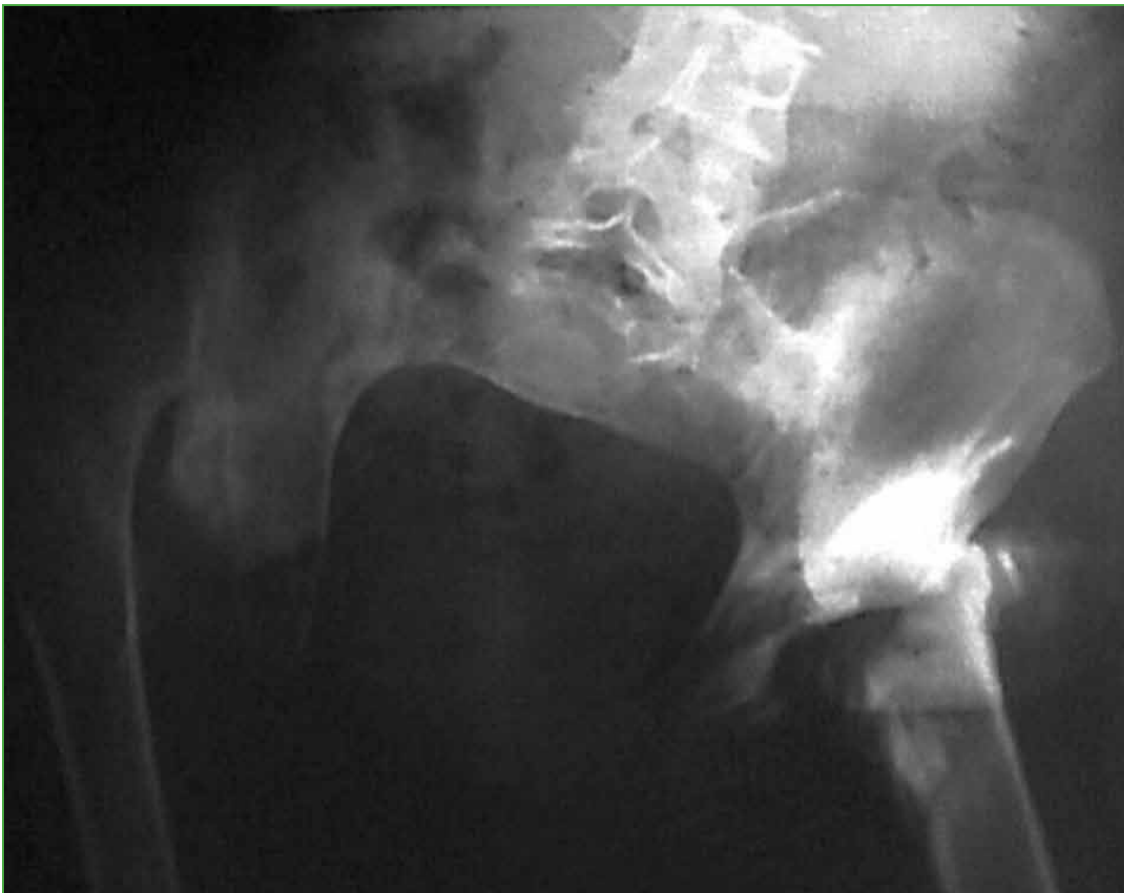
Figura 1. Radiografía de pelvis de frente que muestra la osteomielitis.

Hombre de 25 años que había sufrido un accidente de moto cinco años atrás. La lesión le produjo una fractura a nivel de D10 y un cuadro de paraplejia con nivel sensitivo compatible con la lesión. Su estado neurológico se clasificó como Frankel A. Los malos cuidados higiénicos le provocaron escaras múltiples en piernas, sacro y trocánteres, que obligaron a realizar varios procedimientos quirúrgicos, inclusive la amputación infrarrotuliana de ambas piernas (Figura 1). Este cuadro irreversible continuó evolucionando y finalizó con el desarrollo de una osteomielitis pélvica masiva que requirió la colocación de una talla vesical permanente y una cirugía de Hartman (colostomía).