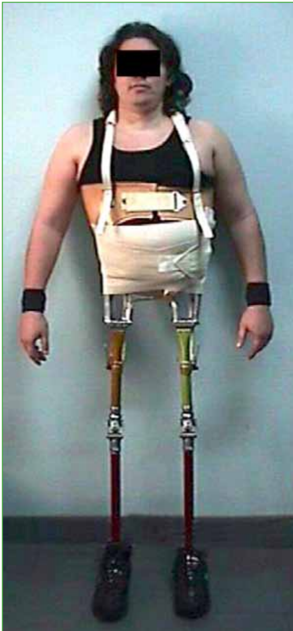
Figura 8. Paciente con equipamiento completo.

Una vez montada la prótesis se inició el proceso de aprendizaje para su utilización. Lograr la bipedestación fue el objetivo inicial del tratamiento, luego, la deambulación (de manera pendulante con andador), y finalmente sentarse y subir y bajar escalones. Todo este proceso duró aproximadamente seis meses hasta que el paciente logró su independencia. Posteriormente, se logró que pudiera conducir vehículos adaptados. Por último, la prótesis fue recubierta con una espuma plástica para mejorar su estética (Figura 9).