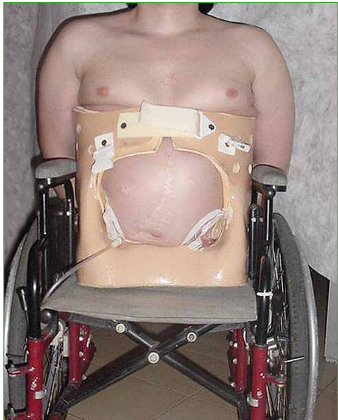
Figura 7. Confección del corsé cesta de un laminado de acrílico y carbono, con acolchado interior de Polyform y apoyo costal.