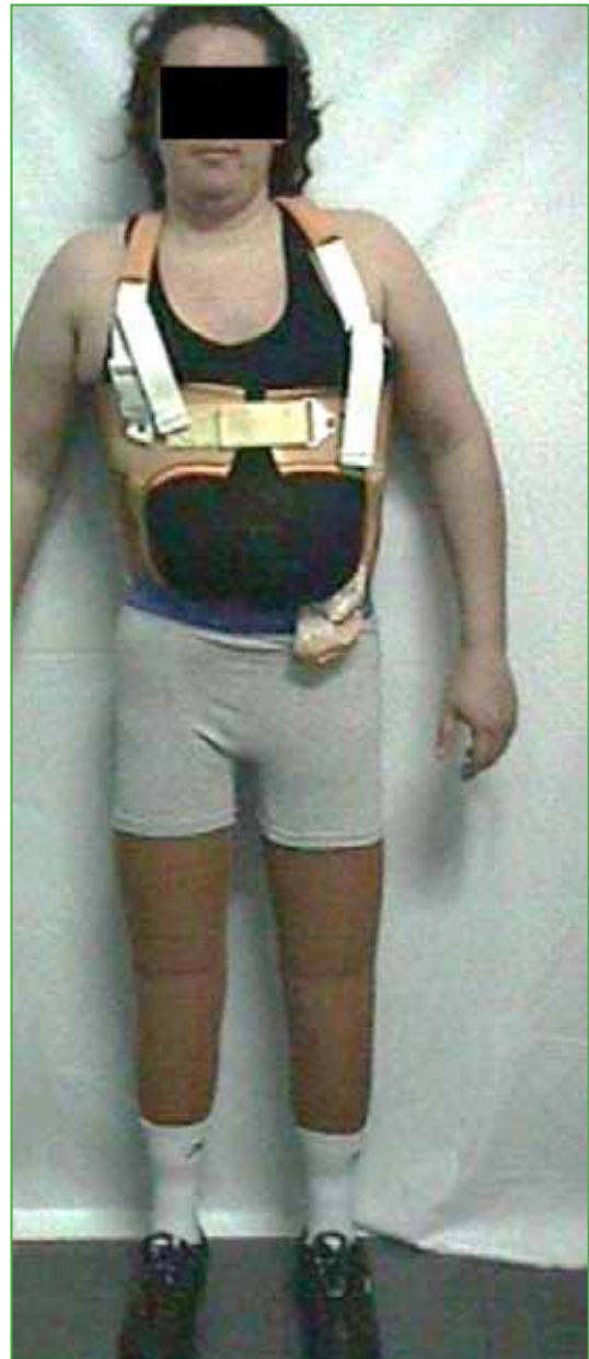
Figura 9. Aspecto estético del implante.