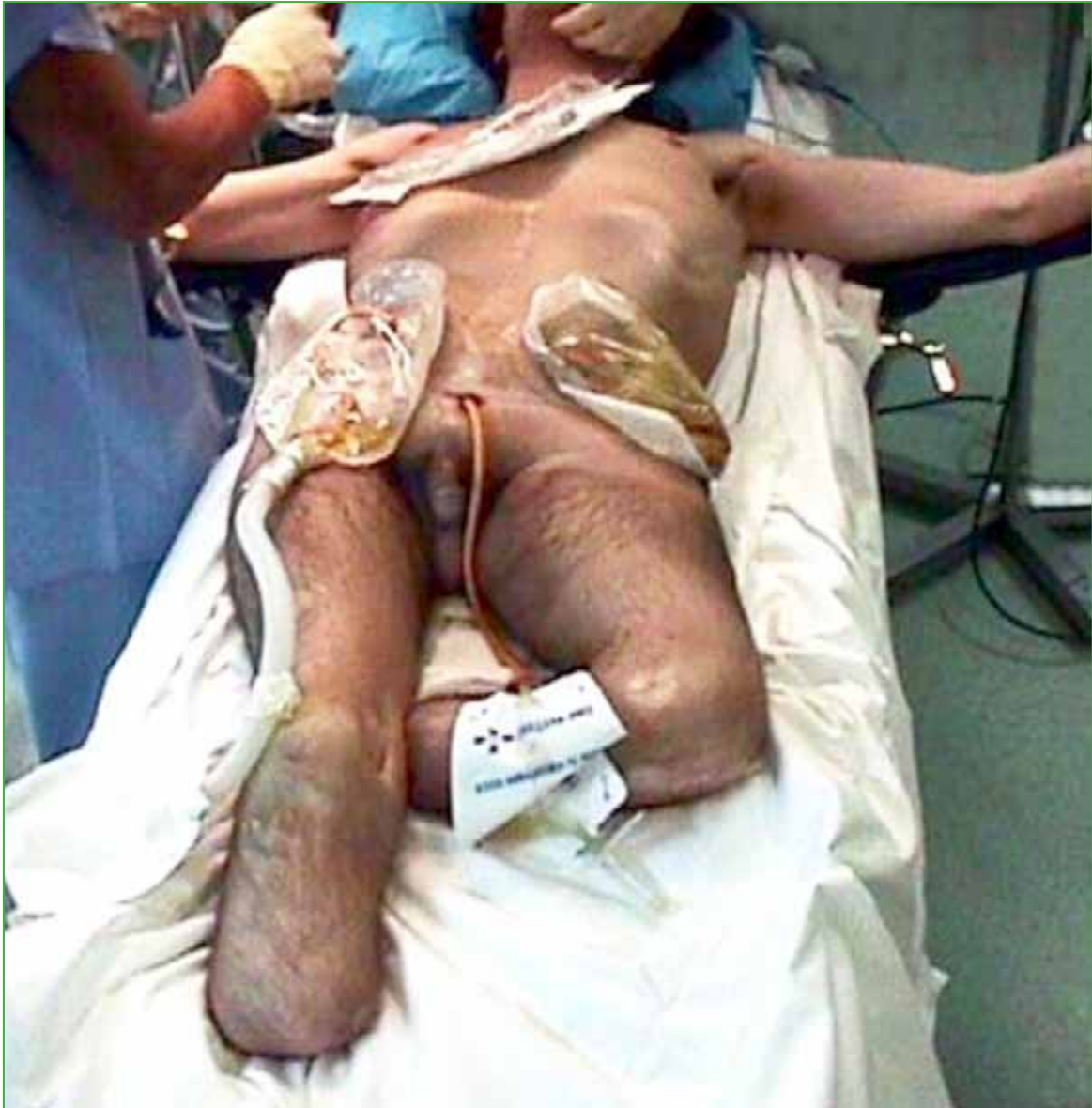
Figura 2. Estado del paciente en el momento de la cirugía.

El procedimiento estuvo a cargo de un equipo multidisciplinario (traumatología, cirugía general y urología) encabezado por uno de los autores (JF), en un solo tiempo quirúrgico bajo anestesia general (Figuras 2 y 3).