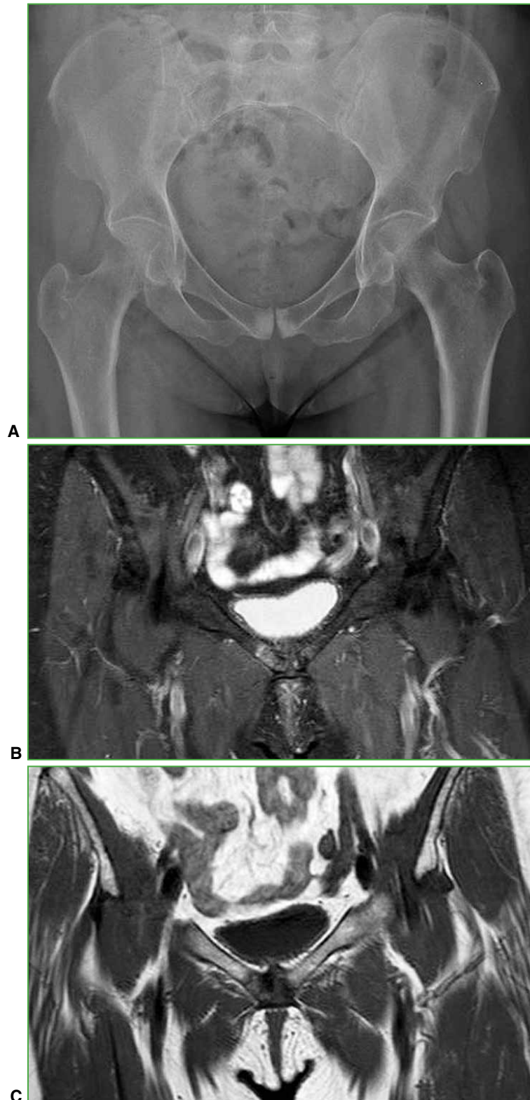
Figura 1. Mujer de 72 años. A. Radiografía anteroposterior de pelvis. Se observa un aumento de la radiopacidad en ambas ramas púbicas. B. Resonancia magnética de pelvis, corte coronal, secuencia STIR. Se visualiza el edema óseo en la rama púbica derecha. C. Resonancia magnética de pelvis, secuencia T1. Se observa el trazo de fractura hipointenso.