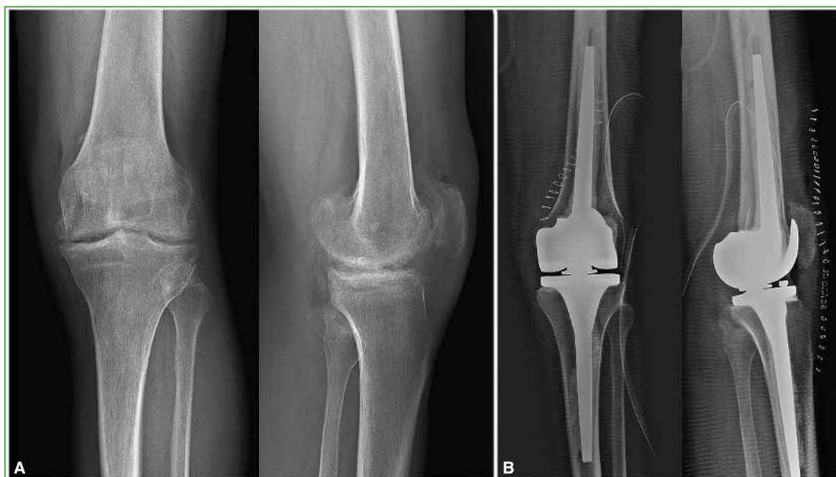
Figura 7. Radiografías de rodilla izquierda, de frente y de perfil, preoperatorias (A) y posoperatorias (B).