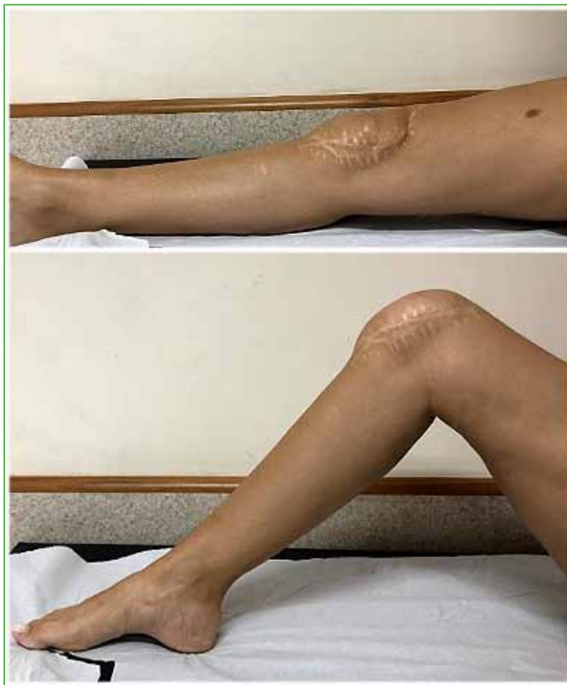
Figura 2. Imágenes clínicas del rango de movilidad posoperatorio.

A los 13 años de seguimiento, la paciente tiene un rango de movilidad de 90°, con una extensión completa (Figura 2).