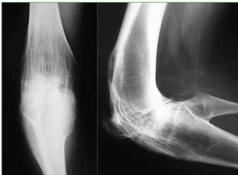
Figura 1. Radiografía preoperatoria de rodilla derecha, de frente y de perfil.

Mujer de 18 años, con artritis reumatoide juvenil y una intervención quirúrgica durante la infancia. Presenta anquilosis de la rodilla derecha en flexión de 100°, sin deformidad significativa en el plano coronal. En la rodilla izquierda, tiene un rango de movilidad de 90°, con una contractura en flexión de 30°. Tiene dificultad para deambular, subir y bajar escaleras y sentarse. El Knee Society Score (KSS) de la rodilla derecha medido antes de la cirugía era 26/50. En las radiografías, se puede observar la anquilosis ósea tanto tibiofemoral como rotulofemoral de la rodilla derecha (Figura 1).