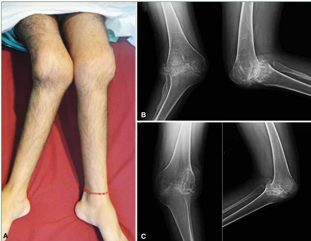
Figura 4. A. Imagen clínica de ambas rodillas que muestra la deformidad coronal y la anquilosis. B y C. Radiografías preoperatorias de rodilla derecha e izquierda, de frente y de perfil.