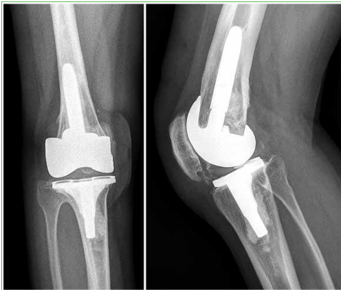
Figura 3. Radiografías posoperatorias de rodilla derecha, de frente y de perfil.

Las radiografías no revelan signos de aflojamiento (Figura 3). El KSS en la rodilla derecha mejoró a 86/90. La paciente refiere estar satisfecha con los resultados.