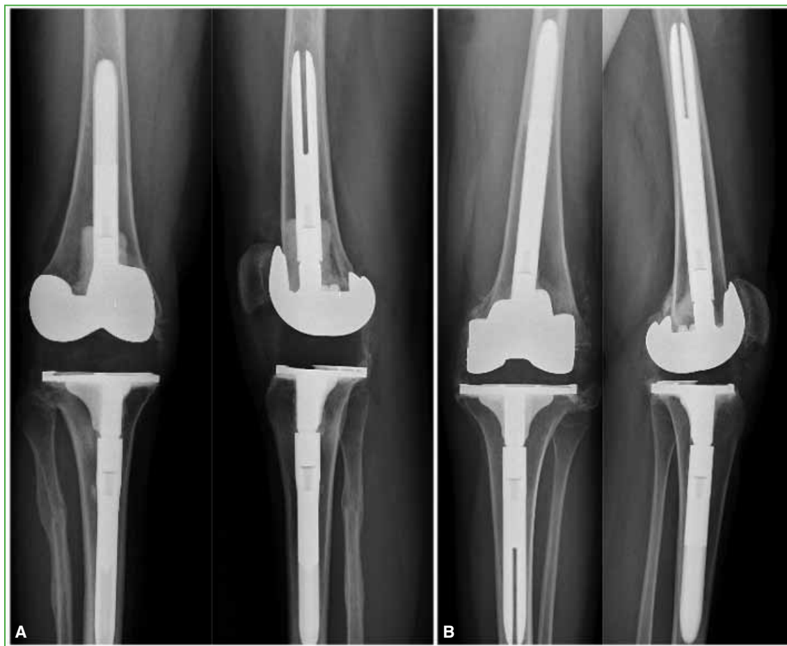
Figura 6. Radiografías posoperatorias de rodilla derecha (A) e izquierda (B), de frente y de perfil.