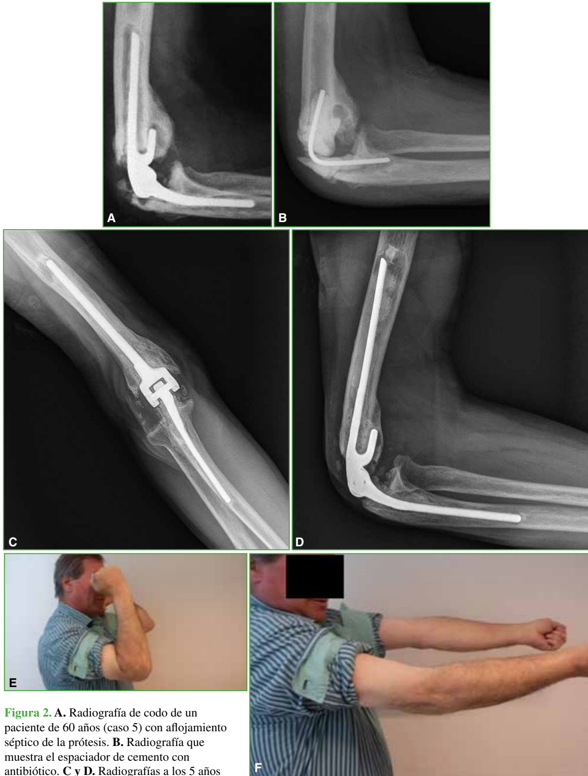
Figura 2. A. Radiografía de codo de un paciente de 60 años (caso 5) con aflojamiento séptico de la prótesis. B. Radiografía que muestra el espaciador de cemento con antibiótico. C y D. Radiografías a los 5 años de la cirugía. E y F. Movilidad final.