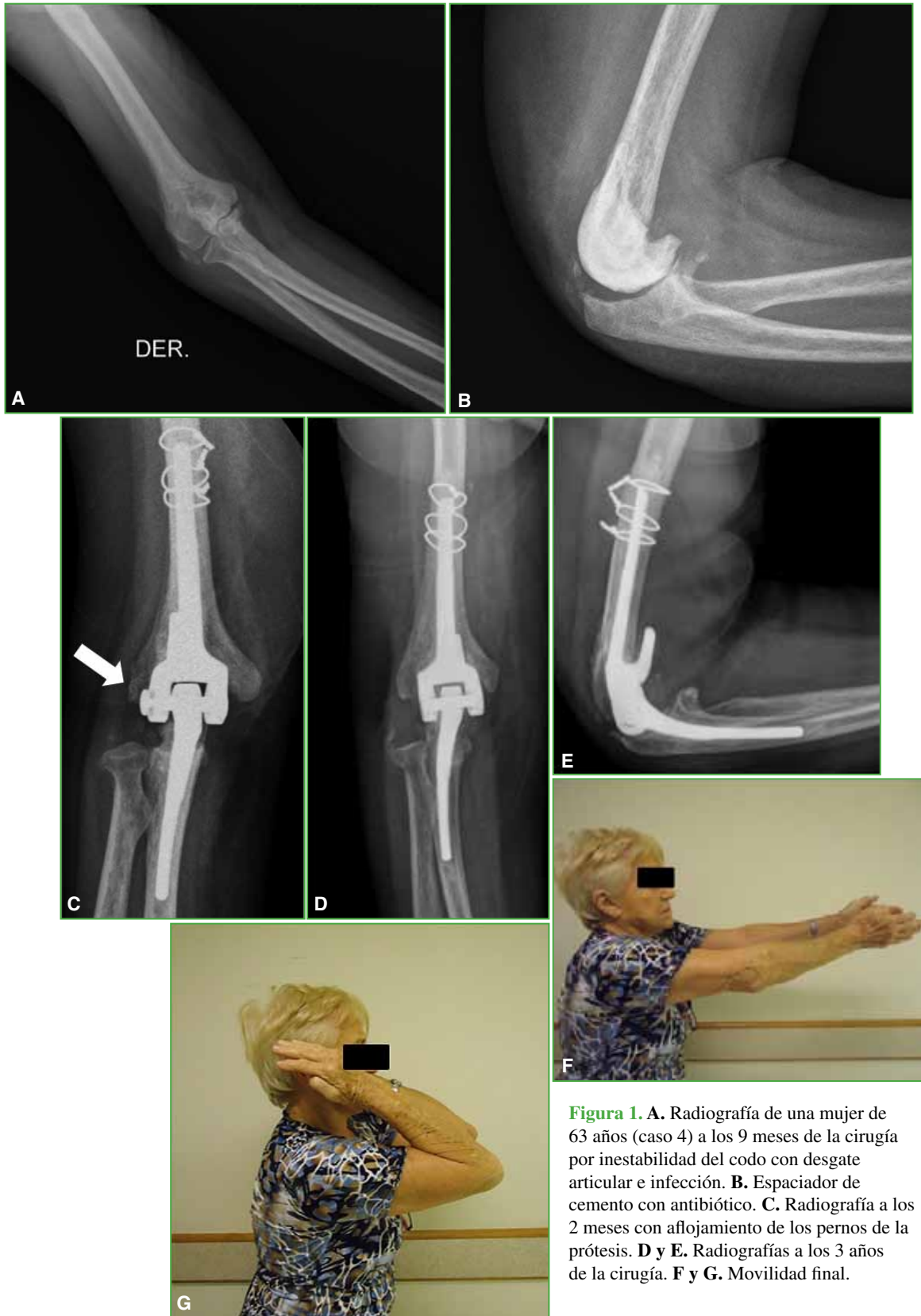
Figura 1. A. Radiografía de una mujer de 63 años (caso 4) a los 9 meses de la cirugía por inestabilidad del codo con desgaste articular e infección. B. Espaciador de cemento con antibiótico. C. Radiografía a los 2 meses con aflojamiento de los pernos de la prótesis. D y E. Radiografías a los 3 años de la cirugía. F y G. Movilidad final.