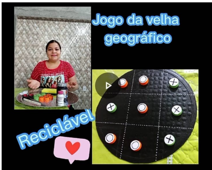
FIGURA 1 Jogo da velha geográfico reciclável

A figura 01 mostra o jogo da velha geográfico o qual para sua construção foram necessários 1 prato para bolo grande redondo e descartável, 1 tinta preta para tecido, 1 tesoura, 1 corretivo escolar branco, 9 tampas de garrafa pet, 1 esponja de cozinha, 1 folha de papel A4 para os símbolos X e O. A