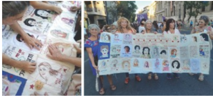
Figuras 1 y 2.

Bandera hecha de retratos bordados, archivo público de Bordando luchas de ayer y de hoy, 2023.