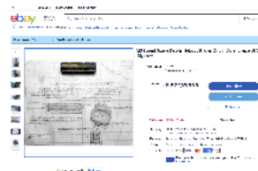
Figura 3 Objeto X disponible en eBay

Quiroga siguió siendo fiel creyente de su origen extraterrestre. Dejó su puesto de teniente coronel después de terminada su misión con el propósito de buscar y encontrar la respuesta del desaparecido objeto X . Se dispuso a ver todas y cada una de las transmisiones que salían en la televisión, revistas especializadas y cualquier información en internet vinculada al objeto X . Desde su retiro de la vida militar se dedicó a buscar y coleccionar cualquier impreso, fotografía o propaganda, hasta que un día, mientras navegaba en el portal de eBay, [16] lo descubrió a la venta. Los datos eran falsos, pero el objeto era inconfundible. Su precio era razonable para ser un objeto único en el mundo.