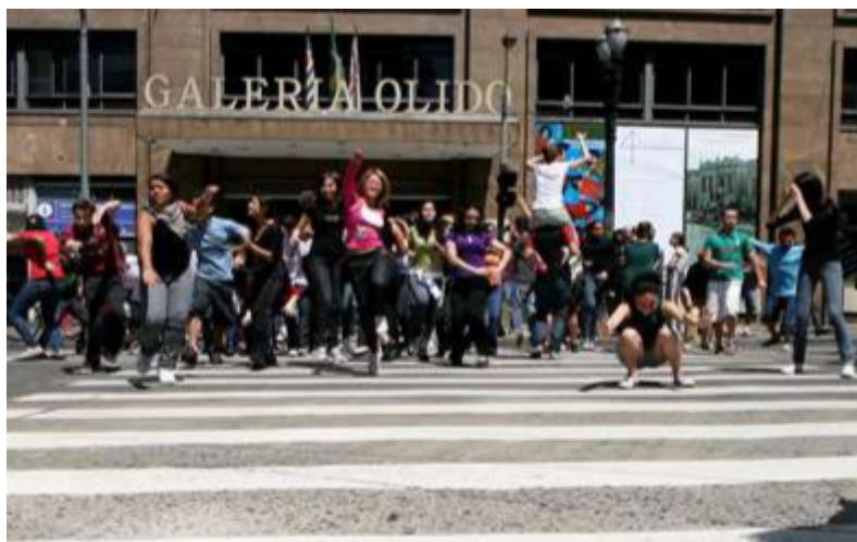
FIGURA 12 Atividade do Programa Vocacional em frente à Galeria Olido PROGRAMA (2015)