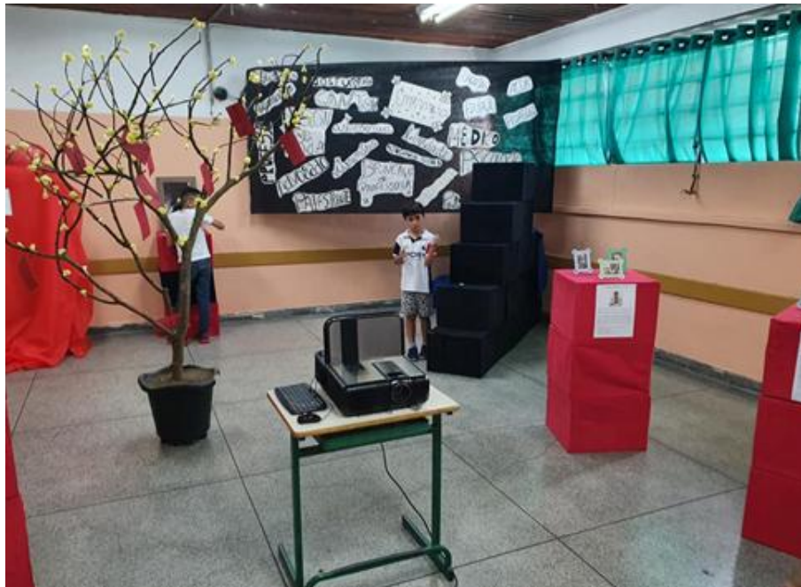
FIGURA 1 Exposição cultural “Uma nova chance”, Escola Municipal Otoniel Mota

Na Escola Estadual Professor Renato Braga, realizei a performance com a “máscara neutra” com os estudantes (Figuras 2, 3 e 4) tendo como referência o videoclipe de Another Brick in the Wall (Part II) , de Pink Floyd, ideia consubstanciada pelos próprios estudantes, que identificaram na “máscara neutra” uma forma visual de metaforizar a alienação, a identificação da manipulação proveniente de grupos políticos, econômicos e sociais que, muitas vezes, movem-nos de forma acrítica e inconscientes do poder e distantes das possibilidades de formação da arte, da cultura e da educação.