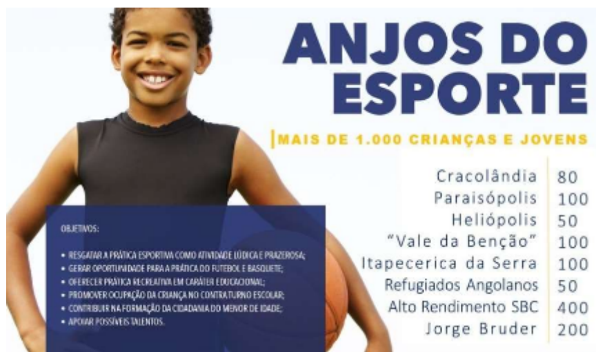
FIGURA 13 Cartaz do Projeto Anjos do Esporte ANJOS (2018)