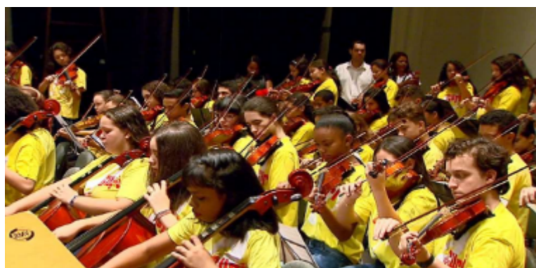
FIGURA 10 Alunos atendidos pelo Projeto Guri G1 SANTOS (2019)

Eleita a Melhor ONG de Cultura de 2018, a Sustenidos administra o Projeto Guri. Desde 2004, é responsável pela gestão do programa no litoral e no interior do estado de São Paulo, incluindo os polos da Fundação CASA. Além do Governo de São Paulo, a Sustenidos conta com o apoio de prefeituras, organizações sociais, empresas e pessoas físicas. Instituições interessadas em investir na Sustenidos, contribuindo para o desenvolvimento integral de crianças e adolescentes, têm incentivo fiscal da Lei Rouanet e do Fundo Municipal da Criança e do Adolescente (FUMCAD). Pessoas físicas também podem ajudar. [...]. (QUEM, 2014). (Figura 10).