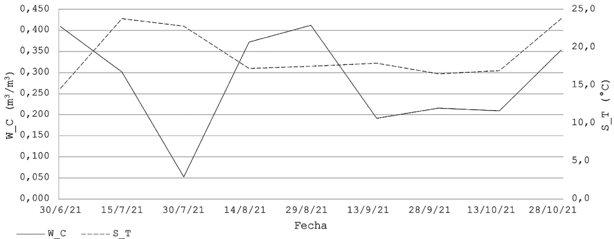
Figura 2. Condiciones de los suelos del área de estudio. Promedios: humedad WC 28% y temperatura ST 19°C.