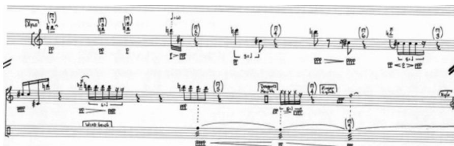
FIGURA 1. PRIMER ACTO I - Introducción: Anochecer Introducción de Tian-Ho, de Samuel Robles. Utilizado con permiso.

En la figura 1 se muestran a los instrumentos de percusión en una configuración circular. Los círculos han sido considerados como símbolos de totalidad y atemporalidad (Adamenko, 2005), siendo un recurso recurrente en las obras de Crumb. Obras como Ancient Voices of Children (1970) y los Makrokosmos I-II (1972-1973) emplean una notación en círculo. Otros compositores también se interesaron por la simbología circular, como Stockhausen en Refrain (1959) y en su solo para percusión Zyklus (1959), en el que se organizan los instrumentos de tal manera que el solista se mueva circularmente. El autor de este trabajo consideró utilizar la simbología circular para resaltar visualmente la simbología de atemporalidad y la influencia de Crumb.