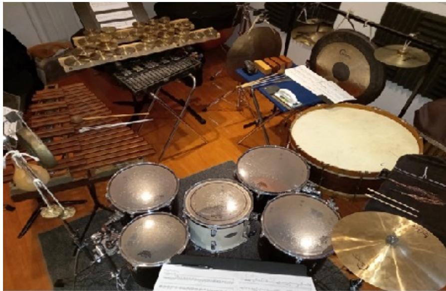
FIGURA 1 Disposición instrumental en Tian-Ho. Configuración propia.

En la figura 1 se muestran a los instrumentos de percusión en una configuración circular. Los círculos han sido considerados como símbolos de totalidad y atemporalidad (Adamenko, 2005), siendo un recurso recurrente en las obras de Crumb. Obras como Ancient Voices of Children (1970) y los Makrokosmos I-II (1972-1973) emplean una notación en círculo. Otros compositores también se interesaron por la simbología circular, como Stockhausen en Refrain (1959) y en su solo para percusión Zyklus (1959), en el que se organizan los instrumentos de tal manera que el solista se mueva circularmente. El autor de este trabajo consideró utilizar la simbología circular para resaltar visualmente la simbología de atemporalidad y la influencia de Crumb.