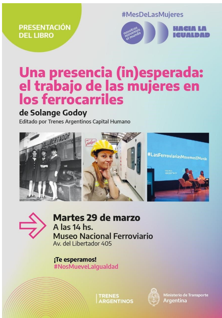
FIGURA 3 Volante digital de la presentación del libro, 2022

Es importante destacar que la publicación tuvo ejemplares en papel y en formato digital. Este último formato facilitó su circulación por medio de diferentes redes sociales digitales. Sobre la base de las imágenes incluidas en el libro, se realizó una muestra fotográfica itinerante que recorrió el Predio Ferial de Tecnópolis, las estaciones terminales de Retiro y Constitución, y el Museo Nacional Ferroviario, pudiendo ser una oportunidad para que una masiva cantidad de personas acceda a ella.